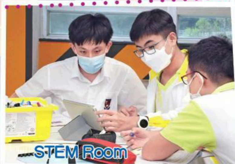
●正式落成不久的STEM Room，光猛的一隅令人精神抖擻，帶來以Lego及Python編程為主的深度培訓班，幫助學生從練習中應用跨學科知識，通過真實生活化主題體驗完整的工程設計循環，以體驗式、項目式教學法提升學生理解複雜的STEM概念的效能；此外更會讓學生參與國際性比賽，藉此鍛煉學生的團隊協作力及解難能力。