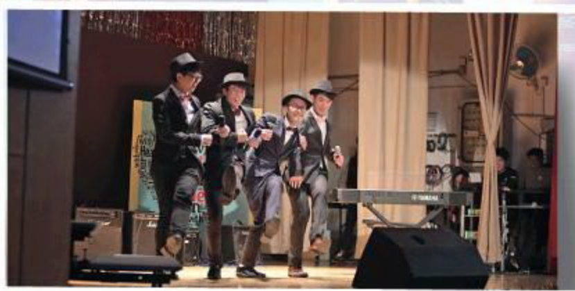
●馬中抱持信念，相信學生只有愉快學習，才能真正學到所需。

2023年，馬中踏入25周年，陳校長談到慶祝活動即表現雀躍，據知她正籌劃一套百老匯歌劇，希望可以讓學生參與這項盛事之餘，同時開闊視野，加強溝通與合作精神；另外又邀請到一位身處國外，任職演藝界的舊生為學校創作一首校慶歌，並會請所有家長及學生來個大合唱，不難想像屆時將何其盛大。「對於未來，我希望把馬中打造成具活力、國際視野、充滿愛及『Future-ready』的學校，培養學生能夠立足未來的能力；至於自己，將一如以往，以學生為本，不負所望。」這樣的願景，由陳校長與其團隊等一班有心人實踐，相信距離目標不會很遠。