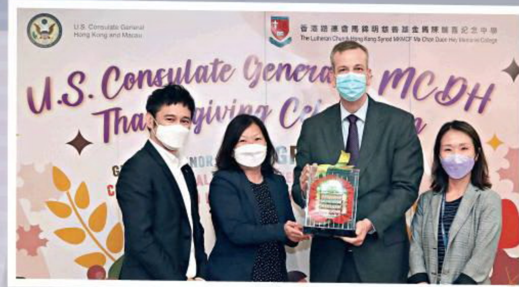
●馬中熱愛以不同形式讓學生體驗各種知識與文化，圖為美國駐港及澳門總領事蒞臨學校參與感恩節活動。

每當有舊生回來探望，細訴他們現在有多開心，如何在自己的領域發揮所長，都令我滿有成功感，加上有信仰加持，以及每每遇上困難的決定，都清晰知道『這是為學生好』，就知道前路應如何走。」