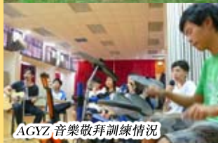
AGYZ 音樂敬拜訓練情況