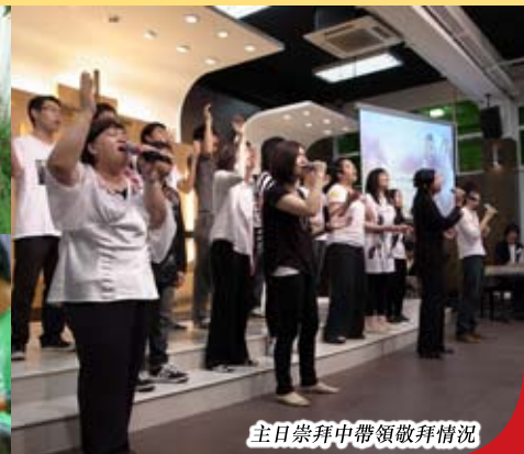
主日崇拜中帶領敬拜情況