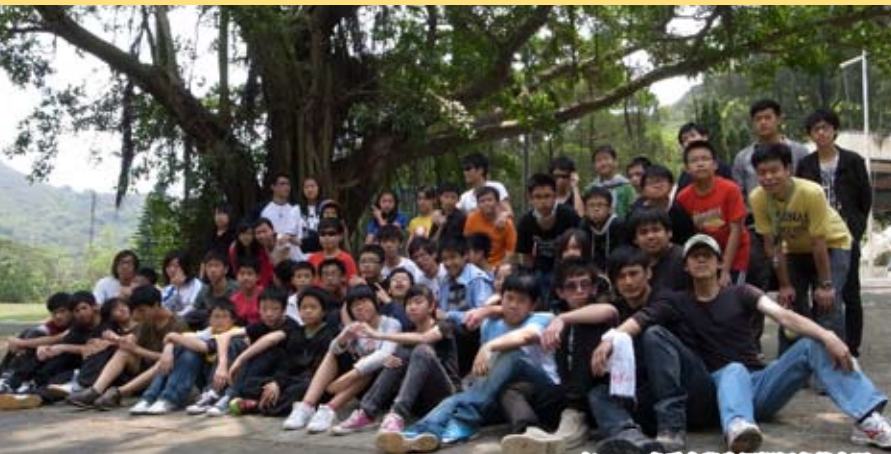
2010年AGYZ春季中學生軍訓福音營合照