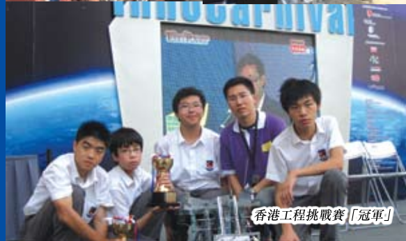
香港工程挑戰賽「冠軍」