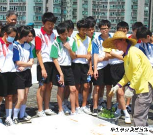
學生學習栽種植物

全體師生一起參與，每位同學從地下領取一袋泥土，傾倒在天台的發泡膠箱內，再由園丁及老師教授同學種植的方法，達致綠化天台。