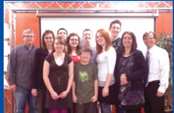
出發前，8位美國學生與3位導師大合照

2010年4月16-24日美國 Concordia High School, Omaha 8位13-18歲的中學生在本校進行學習體驗，他們跟本校學生一同學習、一同渡過校園生活。