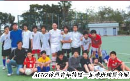
AGYZ沐恩青年特區一足球班球員合照

本校乃一所基督教學校，致力傳揚福音，讓學生獲得聖經的知識及真理的教導，培養學生達成基督化的人格。除了聖經課外，學生可從早會及周會靈修、佈道會、團契、祈禱會、福音周、聯校福音營等活動中認識信仰，親近上帝，建立正確及積極的生命觀。此外，本校亦栽培基督徒學生成為屬靈領袖，鼓勵學生傳福音及學習服侍他人。透過靈德訓練、信仰栽培班及團契領袖訓練營等活動，幫助基督徒學生扎根信仰，裝備人生，定立目標。