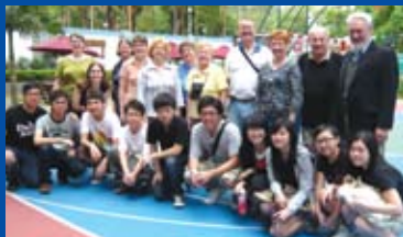
Our Savior Mission Team, Missouri Oct 2008