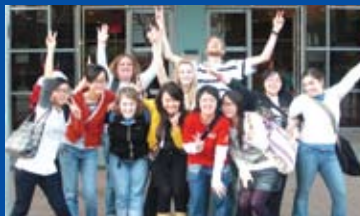
New Dawn Team, Minnesota Feb 2009