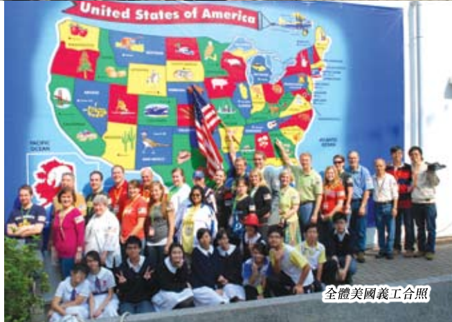
全體美國義工合照

為了讓學生更認識美國文化及在真實的語境中學習英語，我們邀請美國路德會義工團隊來港交流，期間在學校授課、出外觀光、到訪學生家庭用膳，更與師生一同籌辦「美國文化活動日」。學生與美國義工一同架設美國文化特色的攤位、製作遊戲及美國小食，令學校充滿美國人熱情的氣氛。我們更邀請區內小學生參與當日活動，讓他們透過遊戲與美國義工對話，學好英語。