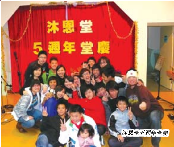
沐恩堂五週年堂慶