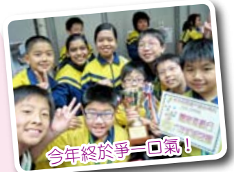
今年終於爭一口氣!