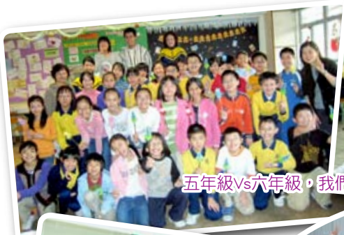
五年級vs六年級，我們有沒有改變呢？