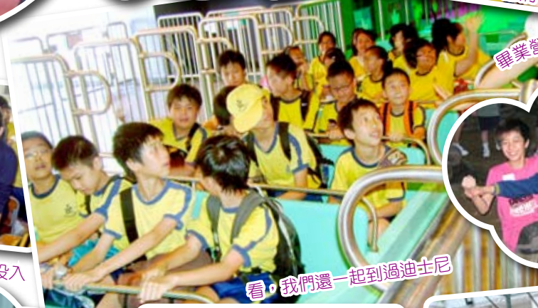
看，我們還一起到過迪士尼