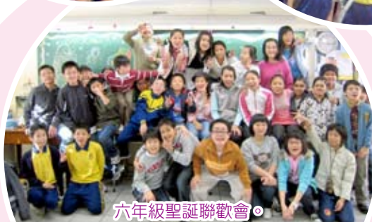
六年級聖誕聯歡會。