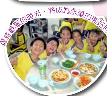
這些歡樂的時光，將成為永遠的美好回憶。