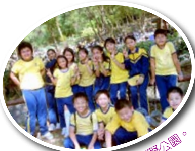
五年級旅行 - 馬鞍山郊野公園。