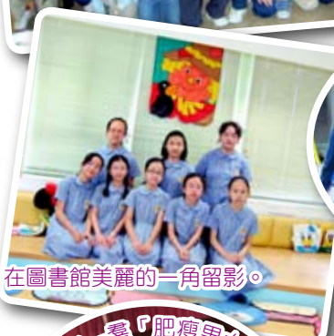
在圖書館美麗的一角留影。