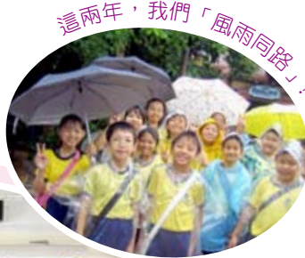
這兩年，我們「風雨同路」！