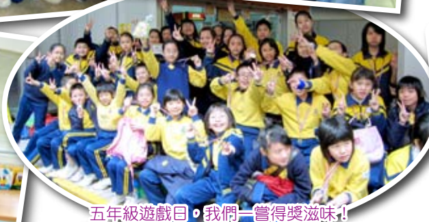
五年級遊戲日，我們一嘗得獎滋味！