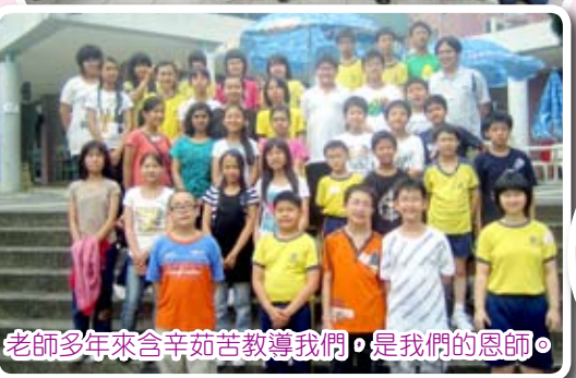
老師多年來含辛茹苦教導我們，是我們的恩師。