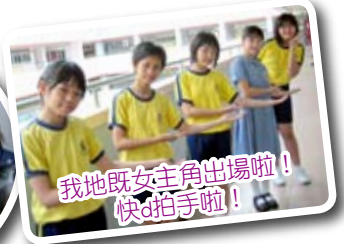
我地既女主角出場啦！快d拍手啦！