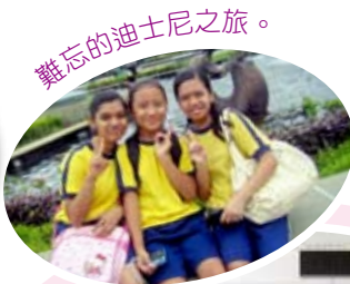
難忘的迪士尼之旅。