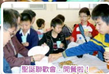
聖誕聯歡會 - 開餐啦！