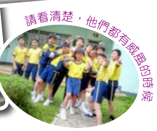
請看清楚，他們都有威風的隊帽