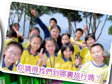
你猜得我們到哪裏旅行嗎？