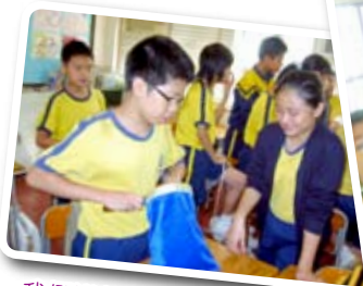
我們進行服務學習時都很投入