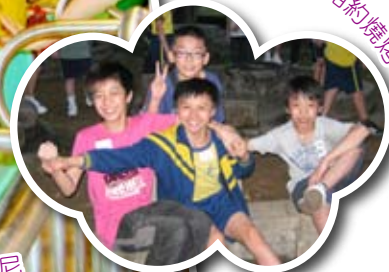
畢業營 - 我們十年後再相約燒烤！