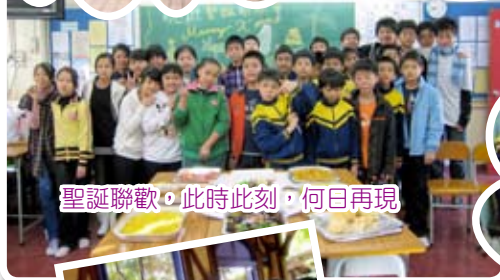
聖誕聯歡，此時此刻，何日再現