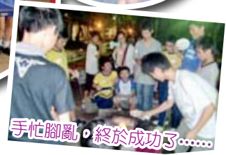
手忙腳亂，終於成功了……