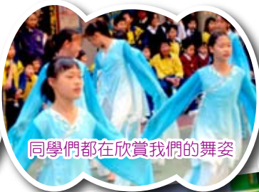
同學們都在欣賞我們的舞姿