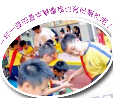
一年一度的嘉年華會我也有份幫忙呢！