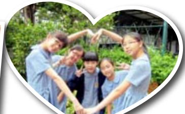
六年小學生活令我們「甜在心頭」，願我們「心心相印」吧！