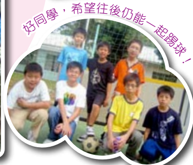
好同學，希望往後仍能一起踢球!