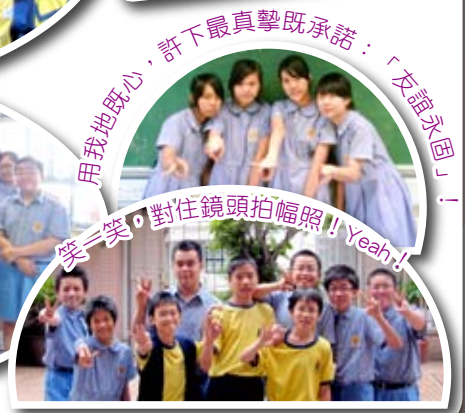
用我地既心，許下最真摯既承諾：「友誼永固」！ 笑笑，對住鏡頭拍幅照！Yeah!!