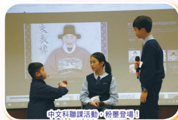
中文科聯課活動 粉墨登場!