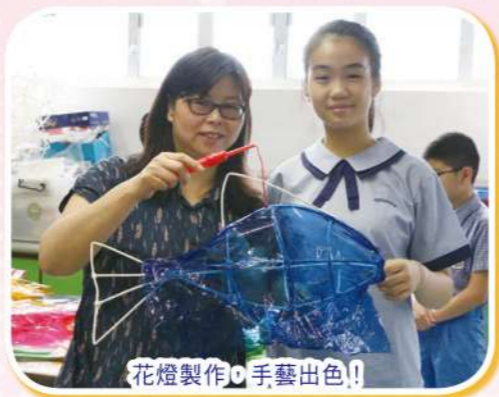
花燈製作 手藝出色!!