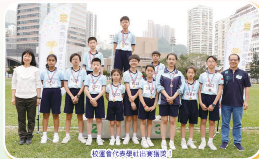
校運會代表學社出賽獲獎!