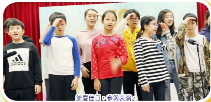
節慶佳日 參與表演