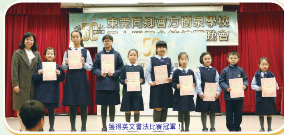
獲得英文書法比賽冠軍!