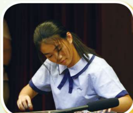
學校才藝大匯演表演彈奏古箏!