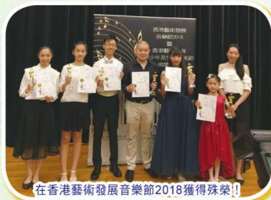
在香港藝術發展音樂節2018獲得殊榮!