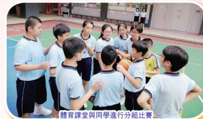
體育課堂與同學進行分組比賽