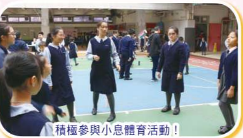
積極參與小息體育活動!