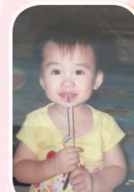
小時候已是活潑可愛!