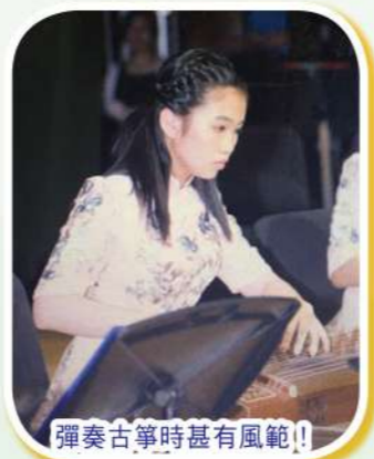
彈奏古箏時甚有風範!!