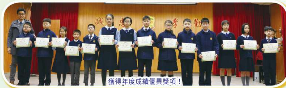
獲得年度成績優異獎項!