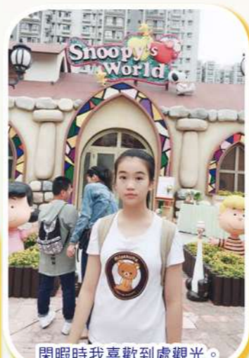
閒暇時我喜歡到處觀光。