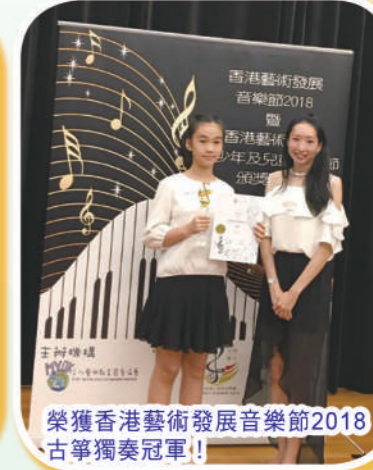
榮獲香港藝術發展音樂節2018古箏獨奏冠軍!