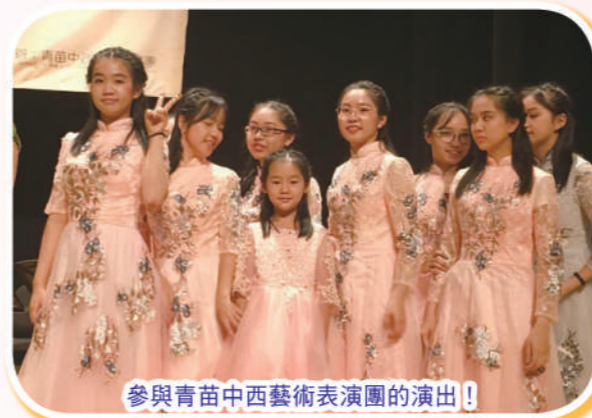
參與青苗中西藝術表演團的演出!