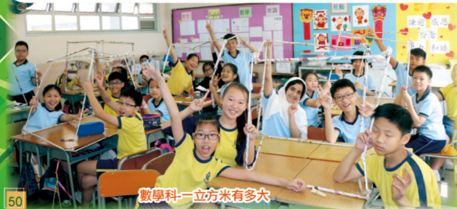
數學科-一立方米有多大