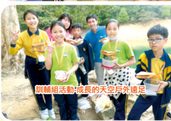
訓練組活動-成長的天空戶外遠足