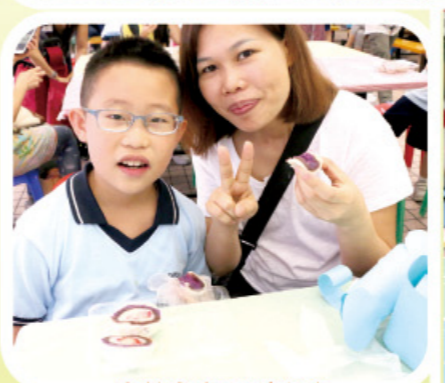
家教會-親子點心班