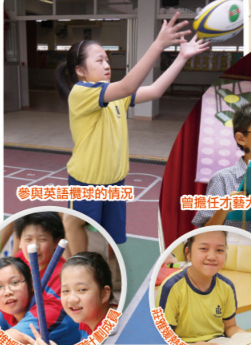
參與英語機球的情況