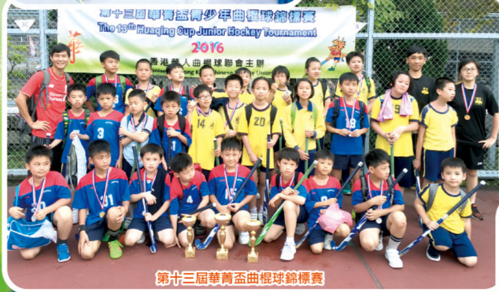
第十三屆華青盃曲棍球錦標賽