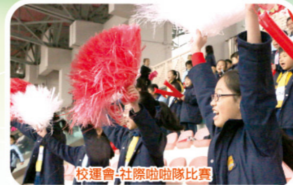
校運會-社際啦啦隊比賽