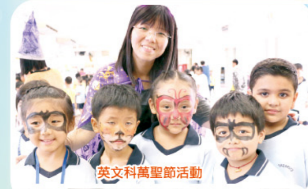
英文科萬聖節活動