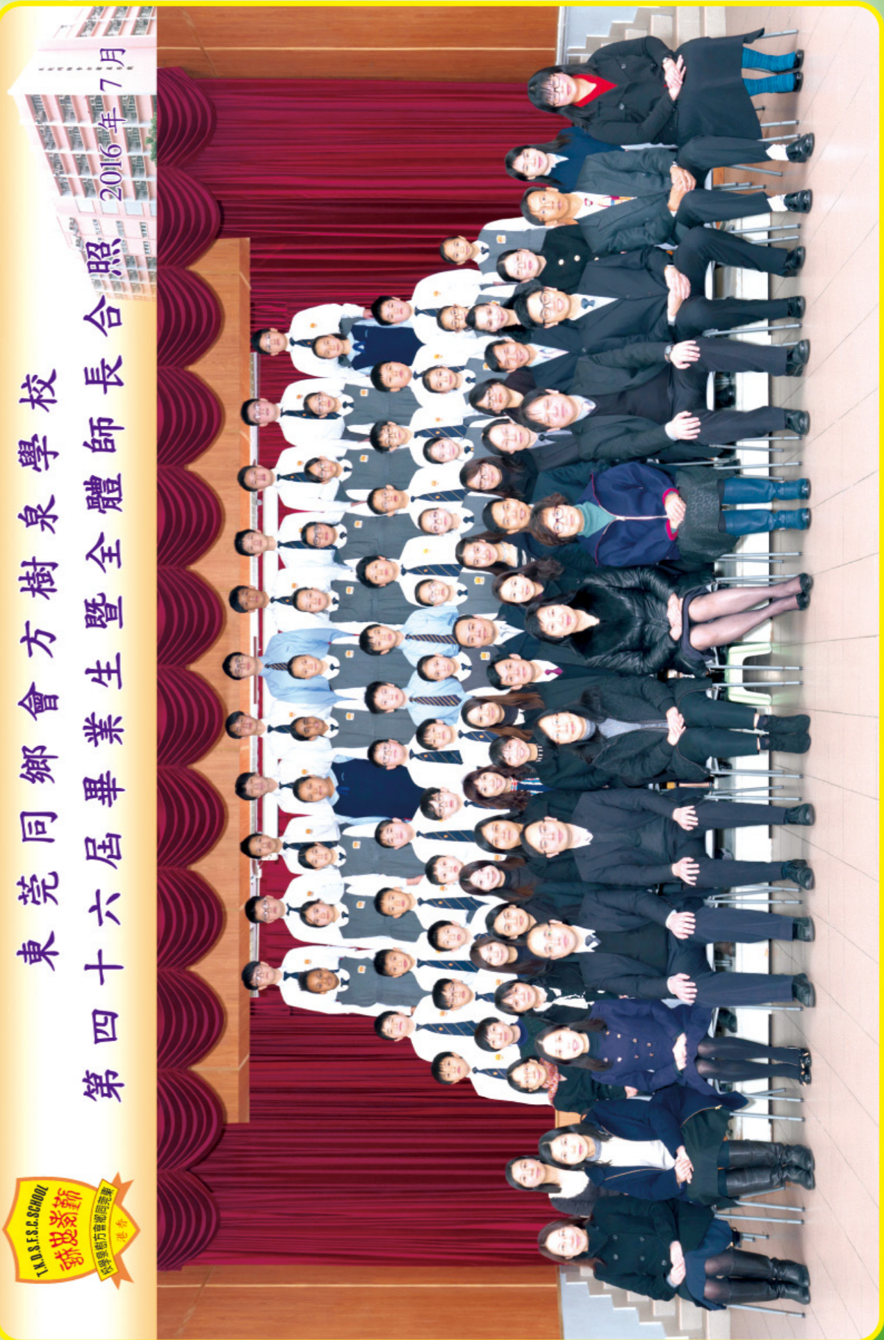
東莞同鄉會方樹泉學校 第四十六屆畢業生暨全體師長合照