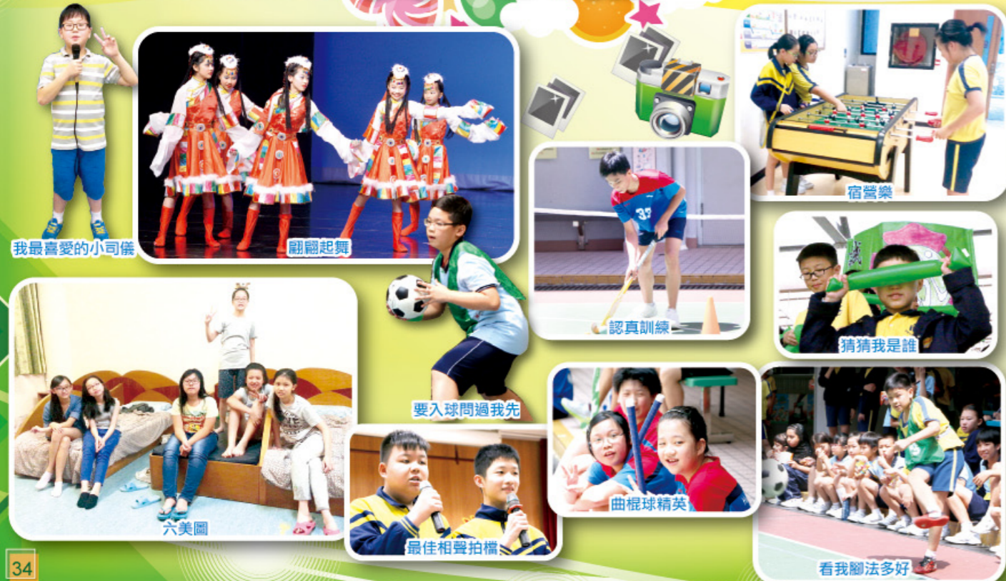
我最喜愛的小司機