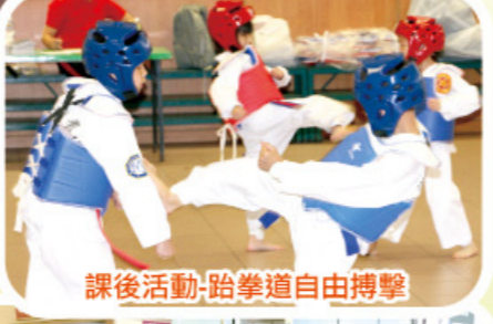
課後活動-跆拳道自由搏擊