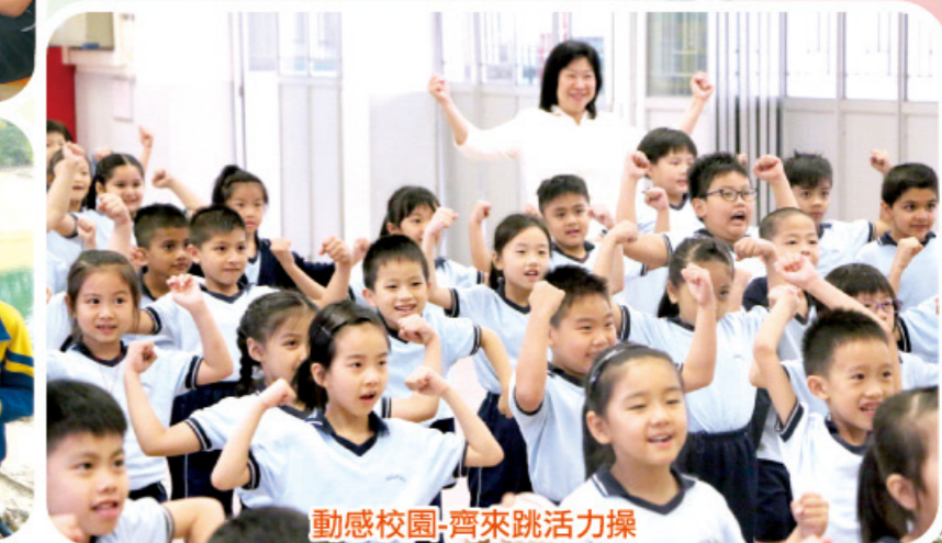
動感校園-齊來跳活力操