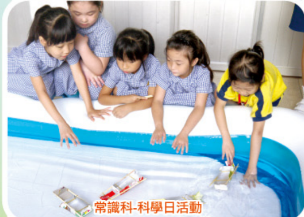
常識科-科學日活動