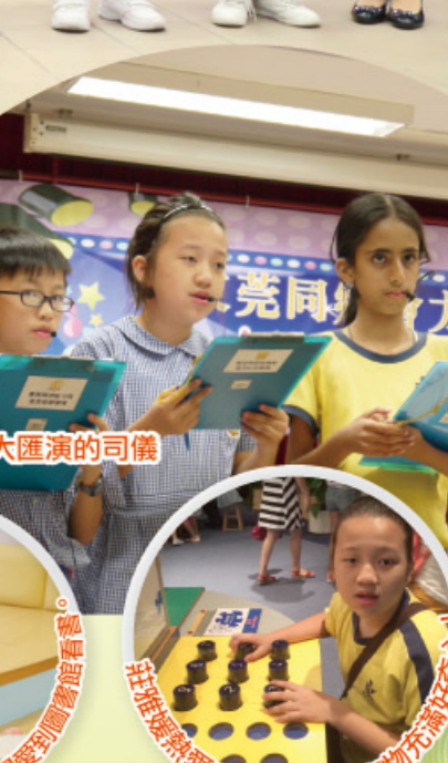
曾擔任才藝大匯演的司儀