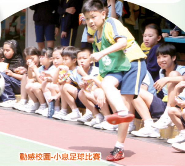
動感校園-小息足球比賽