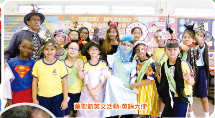
萬聖節英文活動-英語大使