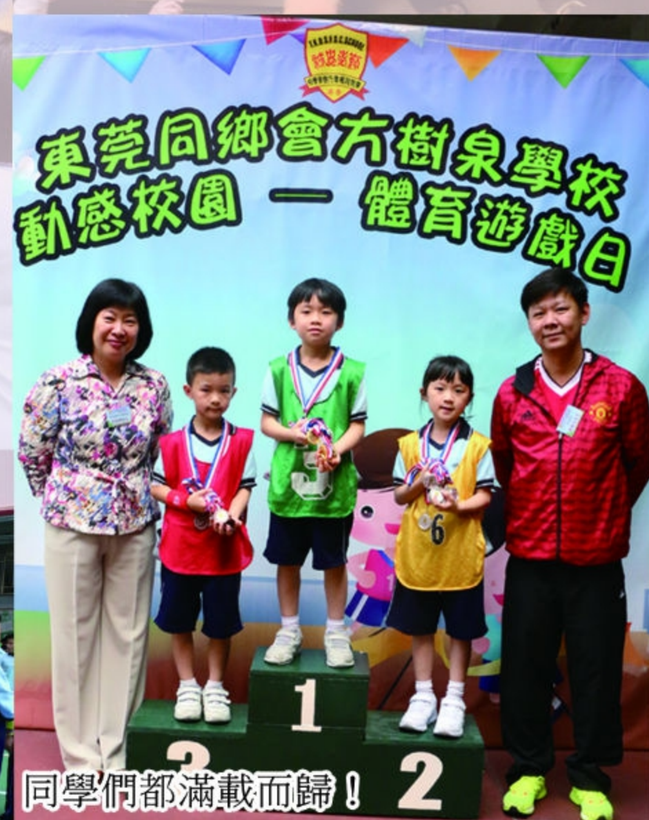
同學們都滿載而歸！