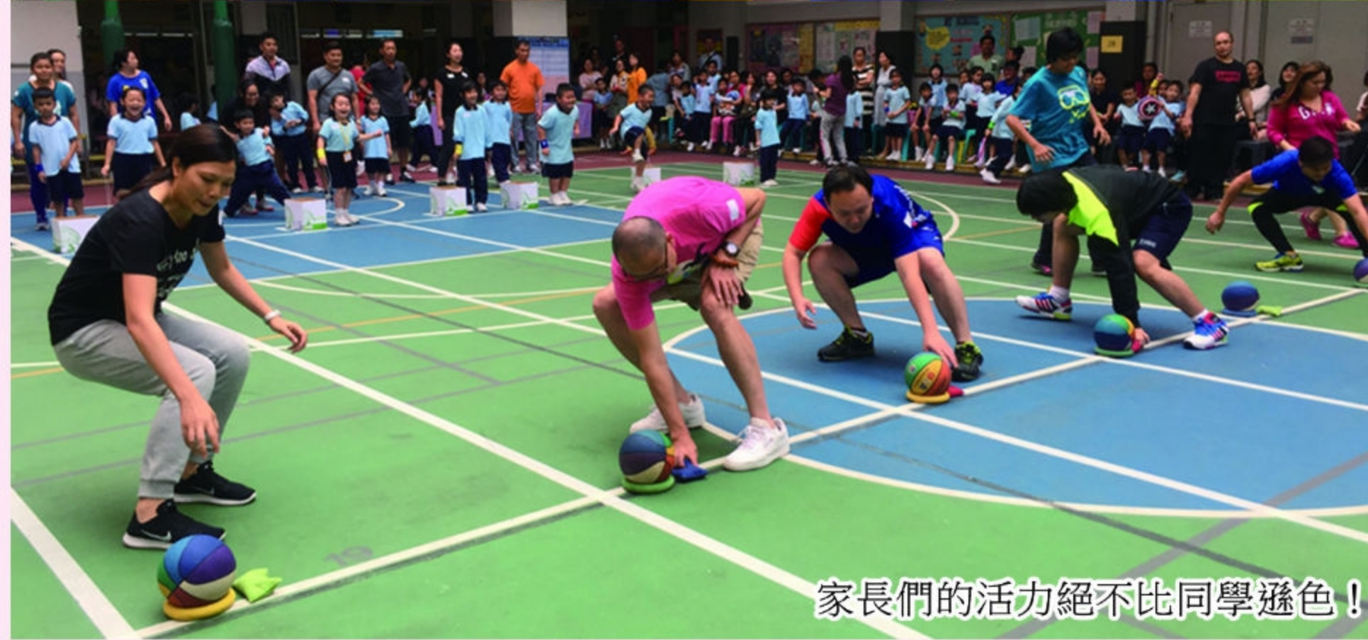
家長們的活力絕不比同學遜色！