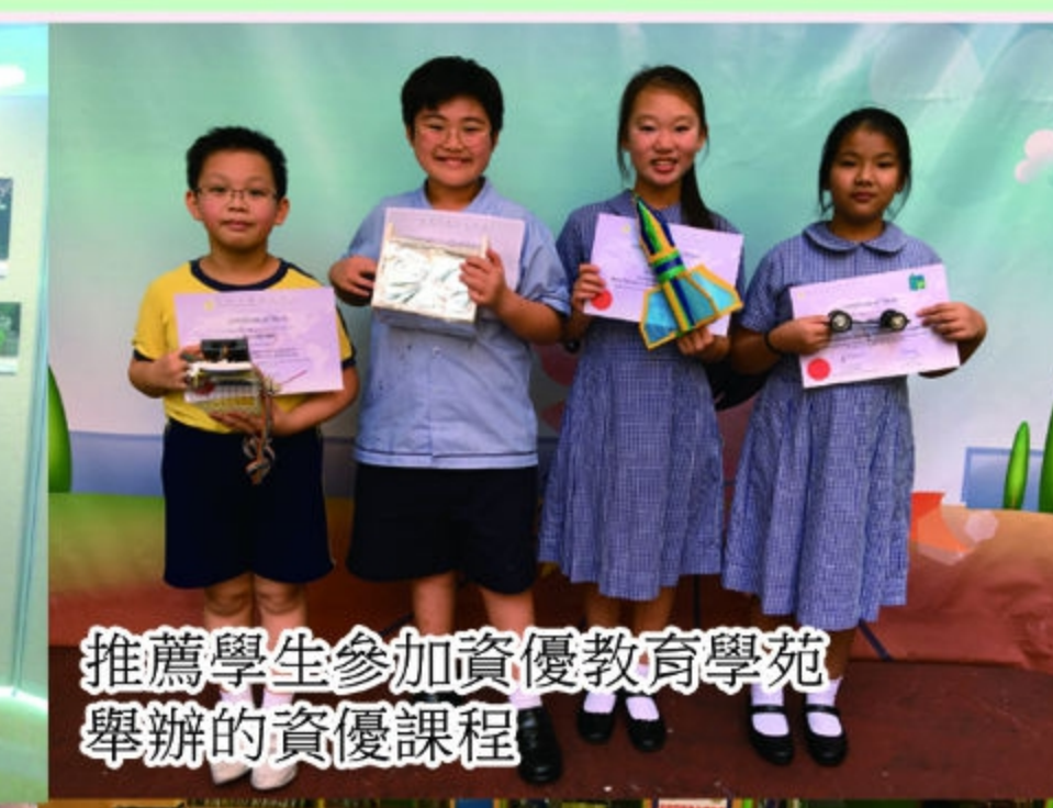
推薦學生參加資優教育學苑舉辦的資優課程