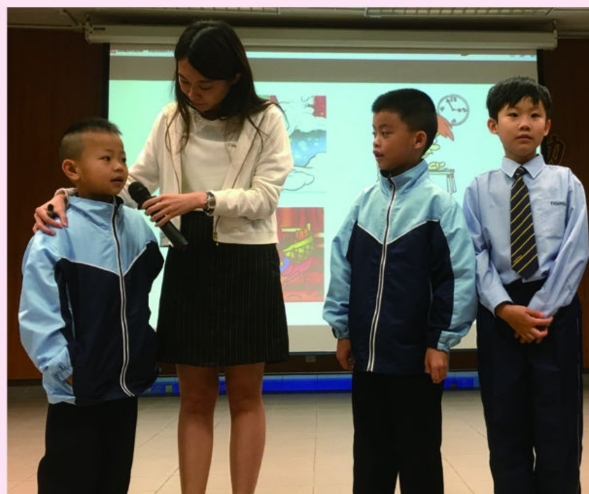
鼓勵學生踴躍發表意見，激發學生思考