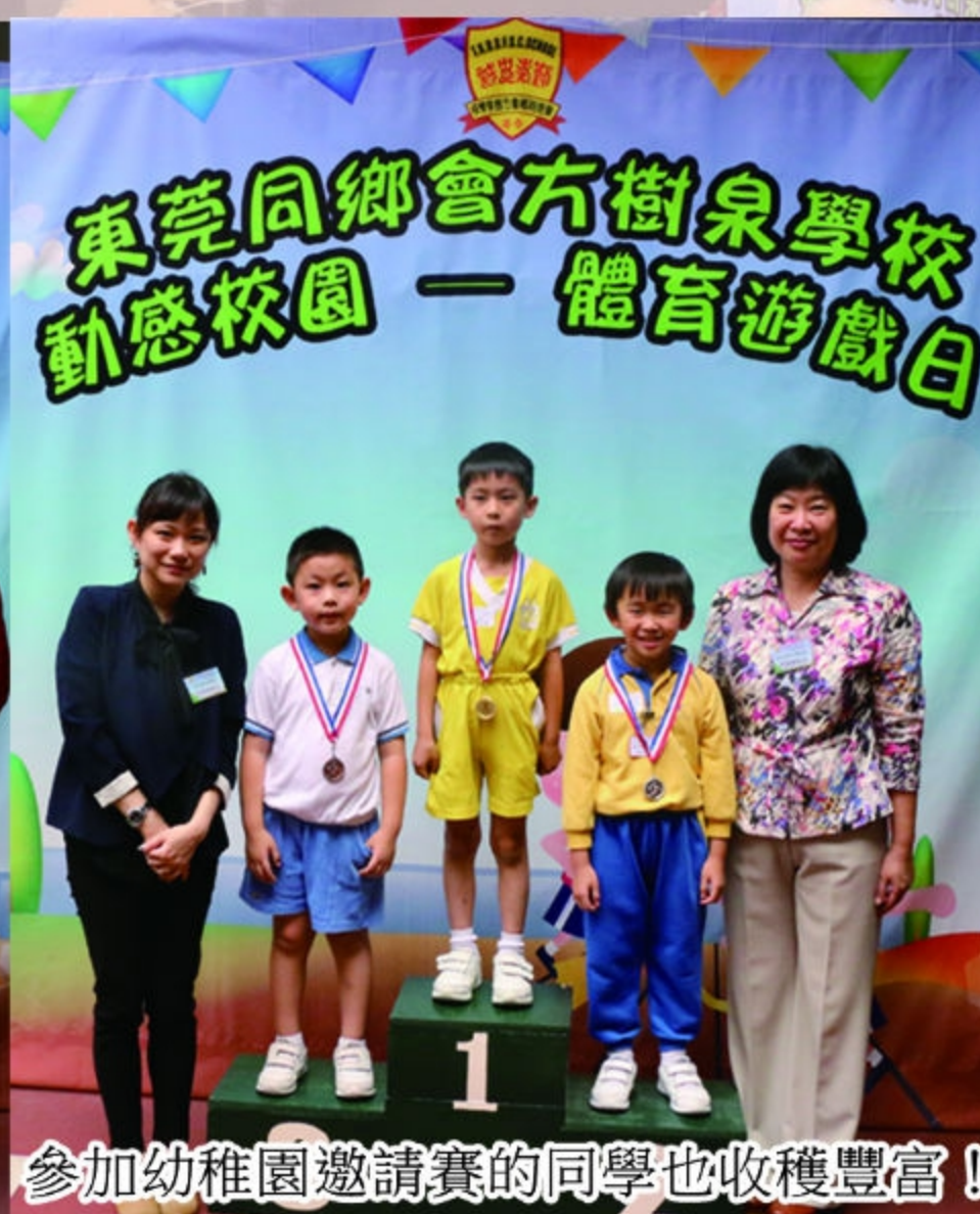
參加幼稚園邀請賽的同學也收穫豐富！