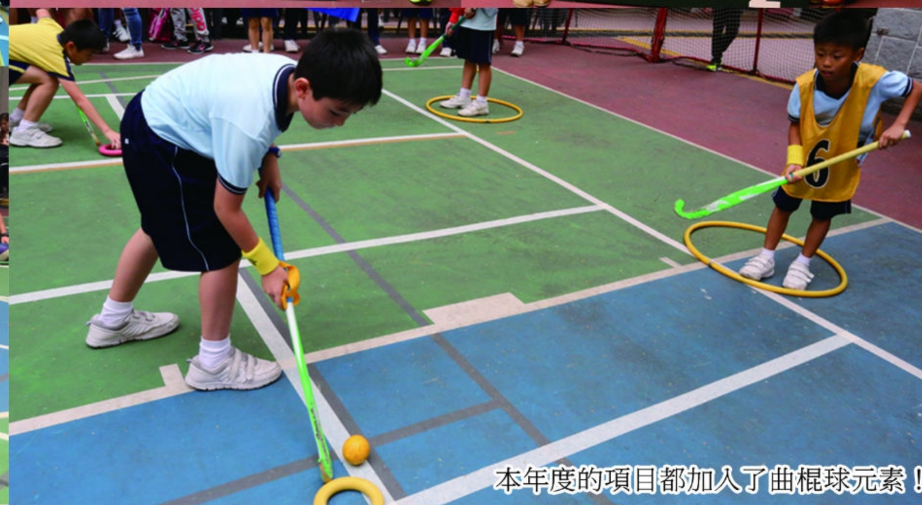
本年度的項目都加入了曲棍球元素！