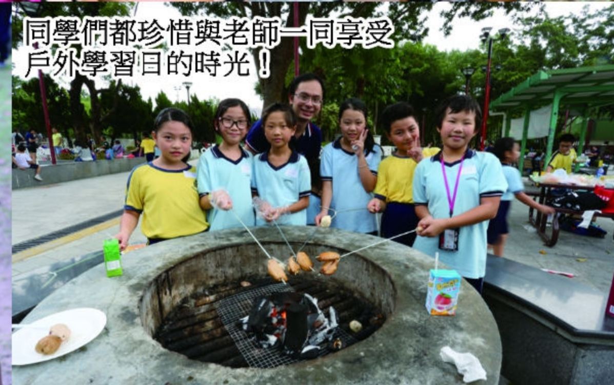
同學們都珍惜與老師一同享受戶外學習日的時光！