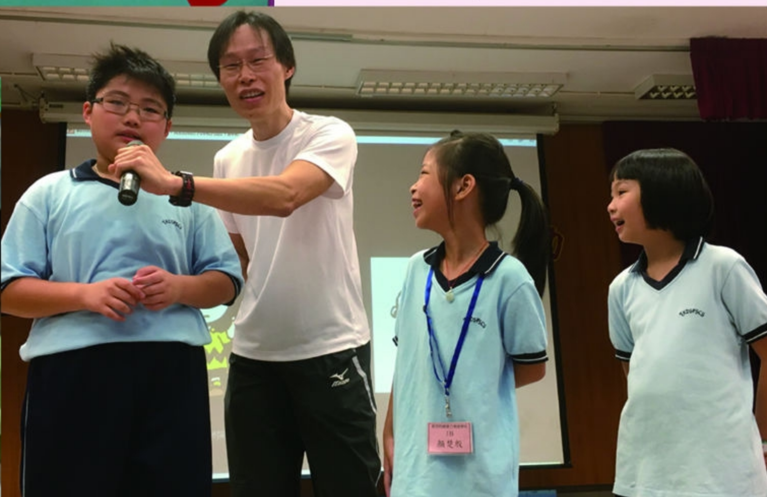
學生主動分享生活經歷