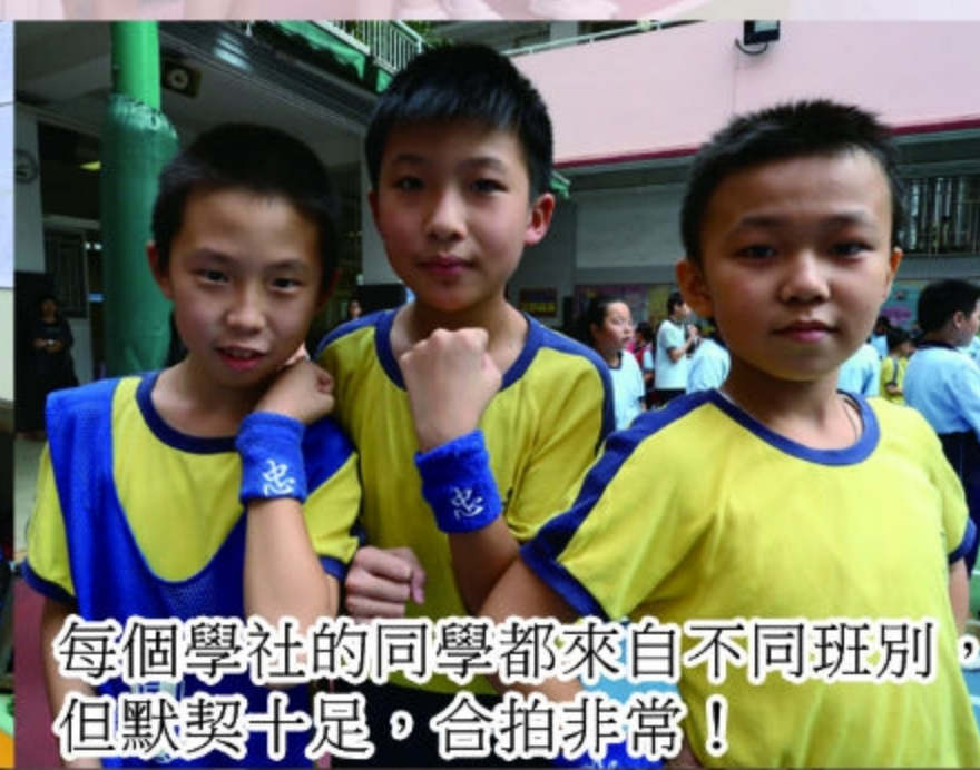
每個學社的同學都來自不同班別，但默契十足，合拍非常！