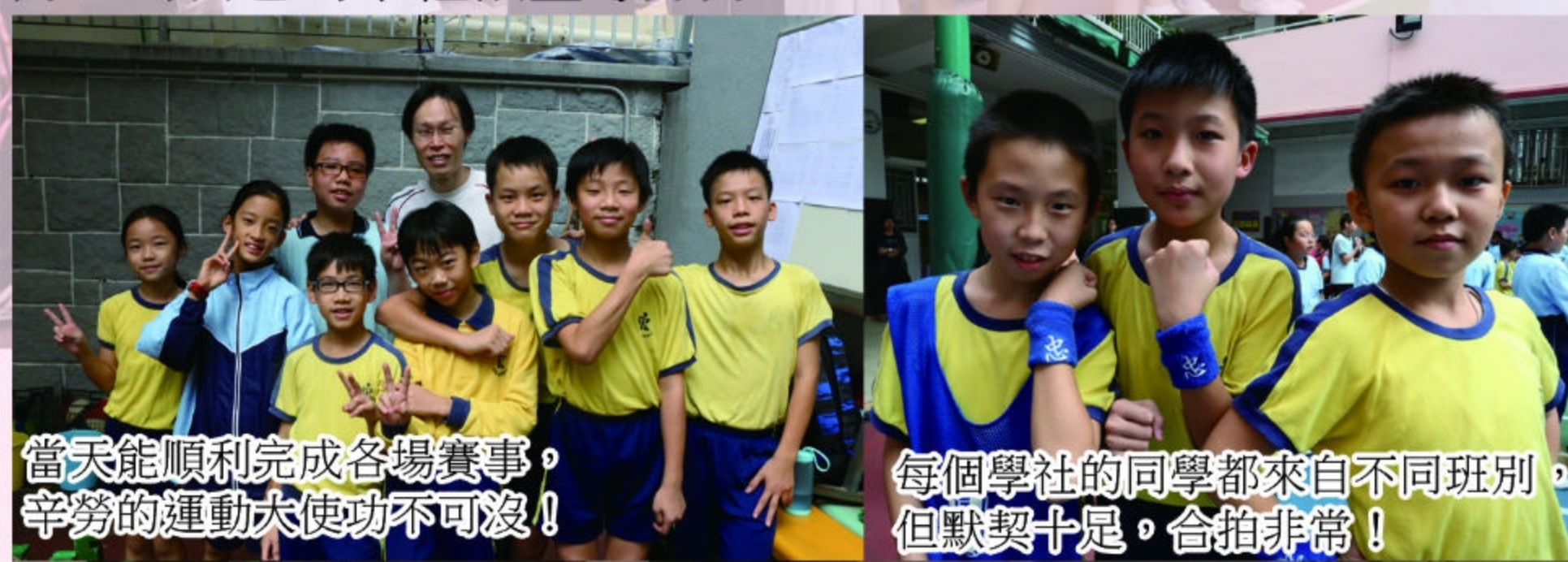
當天能順利完成各場賽事，辛勞的運動大使功不可沒！

本年度的體育遊戲日是第二年以社際形式進行比賽，觀賽的同學都投入非常，落力地為自己的學社歡呼喝采，而比賽的健兒亦竭盡所能，為自己的學社爭取殊榮！ 當天比賽的戰況可說是峰迴路轉！上午一、二年級同學比賽的時段，勤社表現一枝獨秀，接連勝出多個項目；忠社的成績仍一直落後，位居榜末。下午三至六年級同學比賽的時段，勤社繼續領先，但早上時段排在榜末的忠社，參賽的社員仍然戰意激昂，永不言敗，一步一步的向勤社進迫。及至最後一個項目，兩社依然鬥得難分難解。最後，竟然由忠社後來居上，獲得全場總冠軍，結果真是出人意料！ 本學年仍有多項社際比賽，各社同學不要灰心，要繼續努力，為自己的學社傾盡每分力！