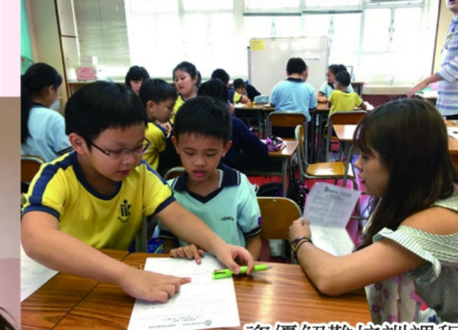
資優解難培訓課程