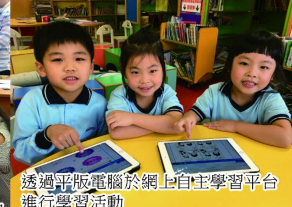
透過平板電腦於網上自主學習平台進行學習活動