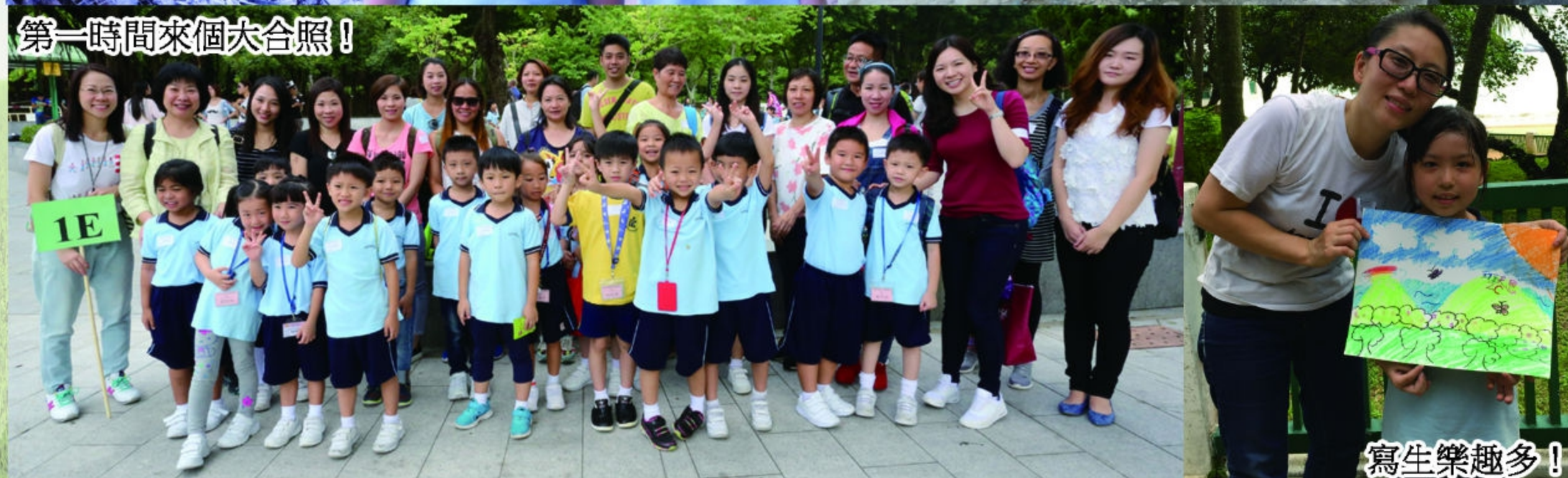
第一時間來個大合照！