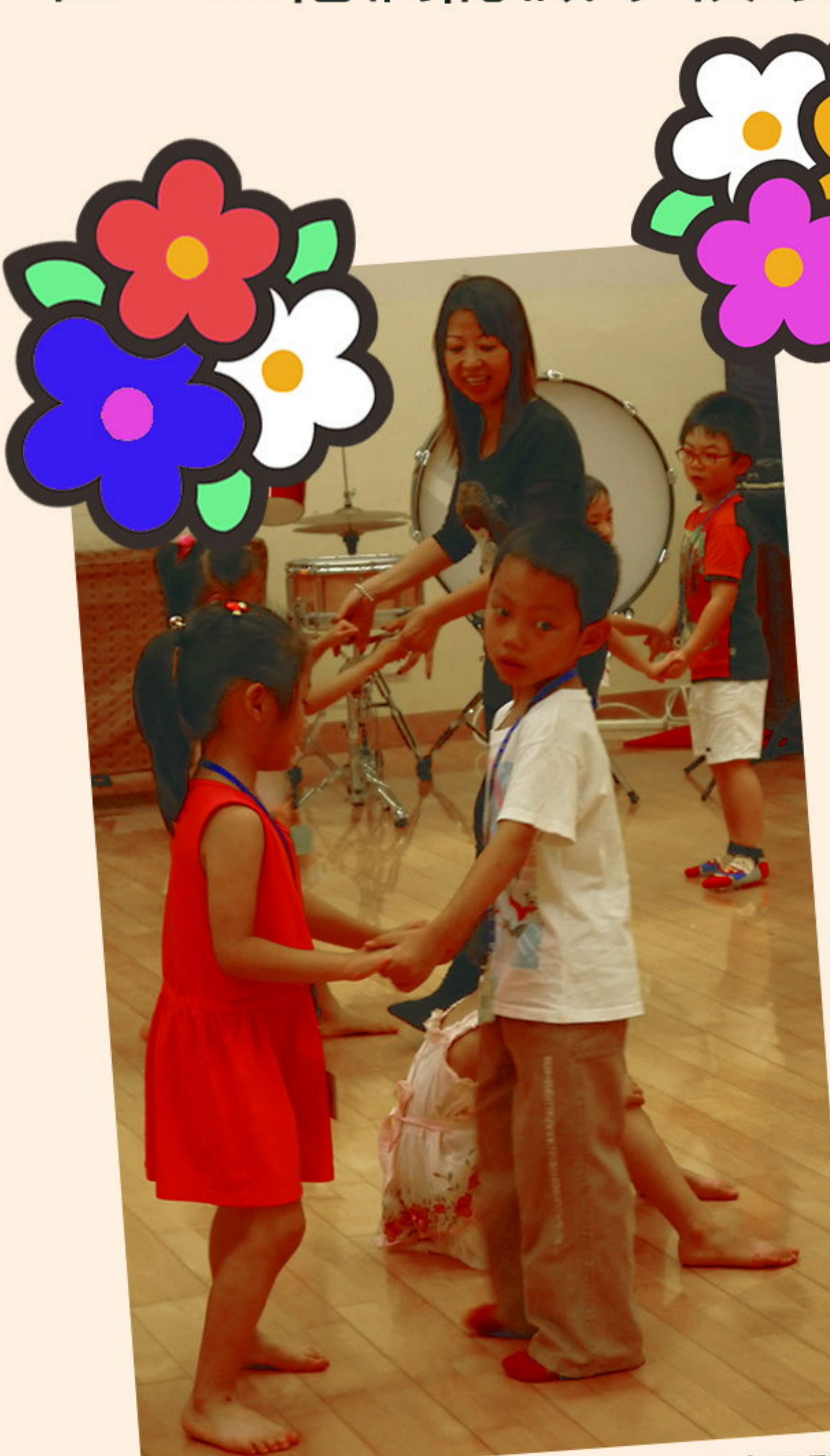
左右左……兒童舞蹈真好玩！