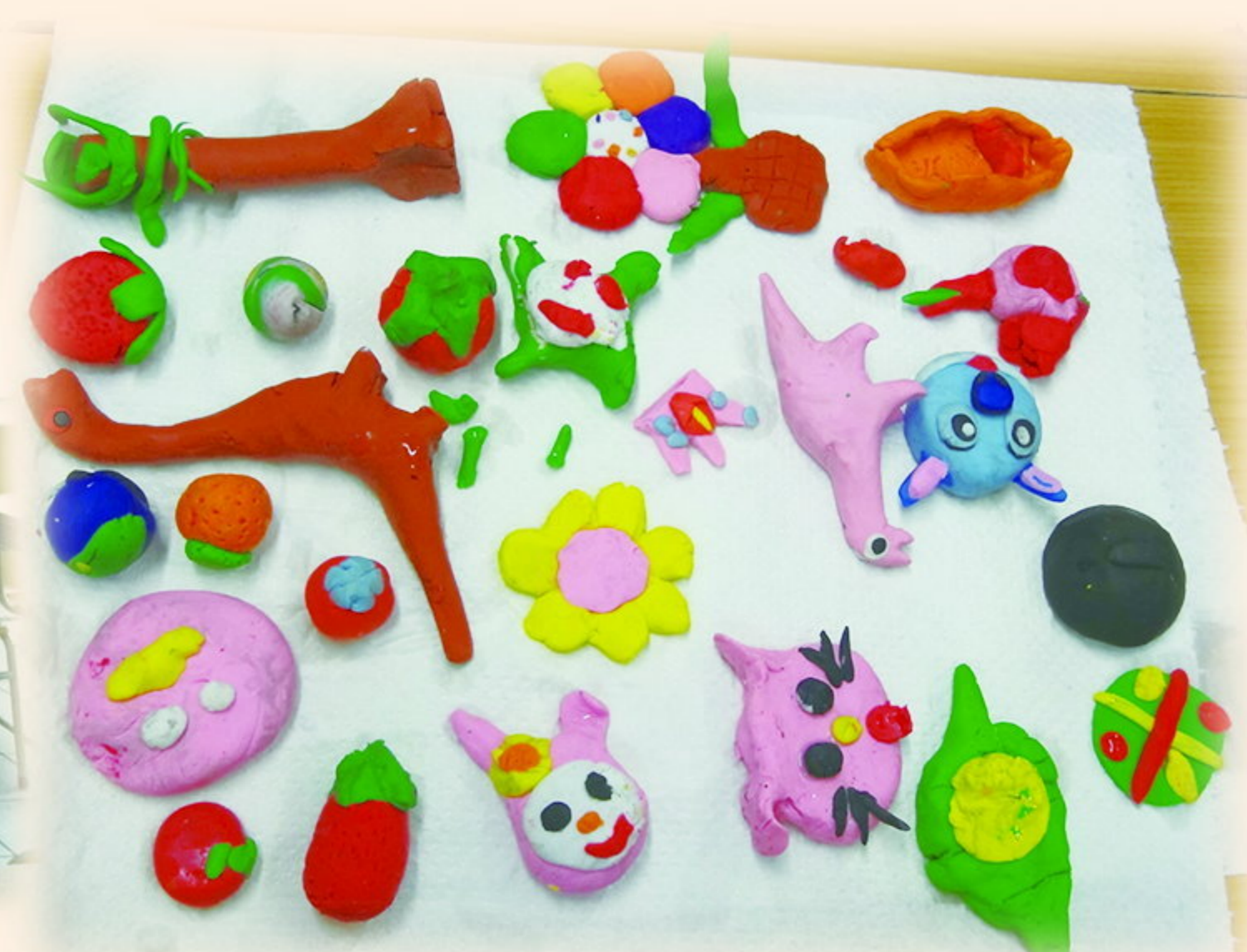
我們獨一無二的橡皮擦。