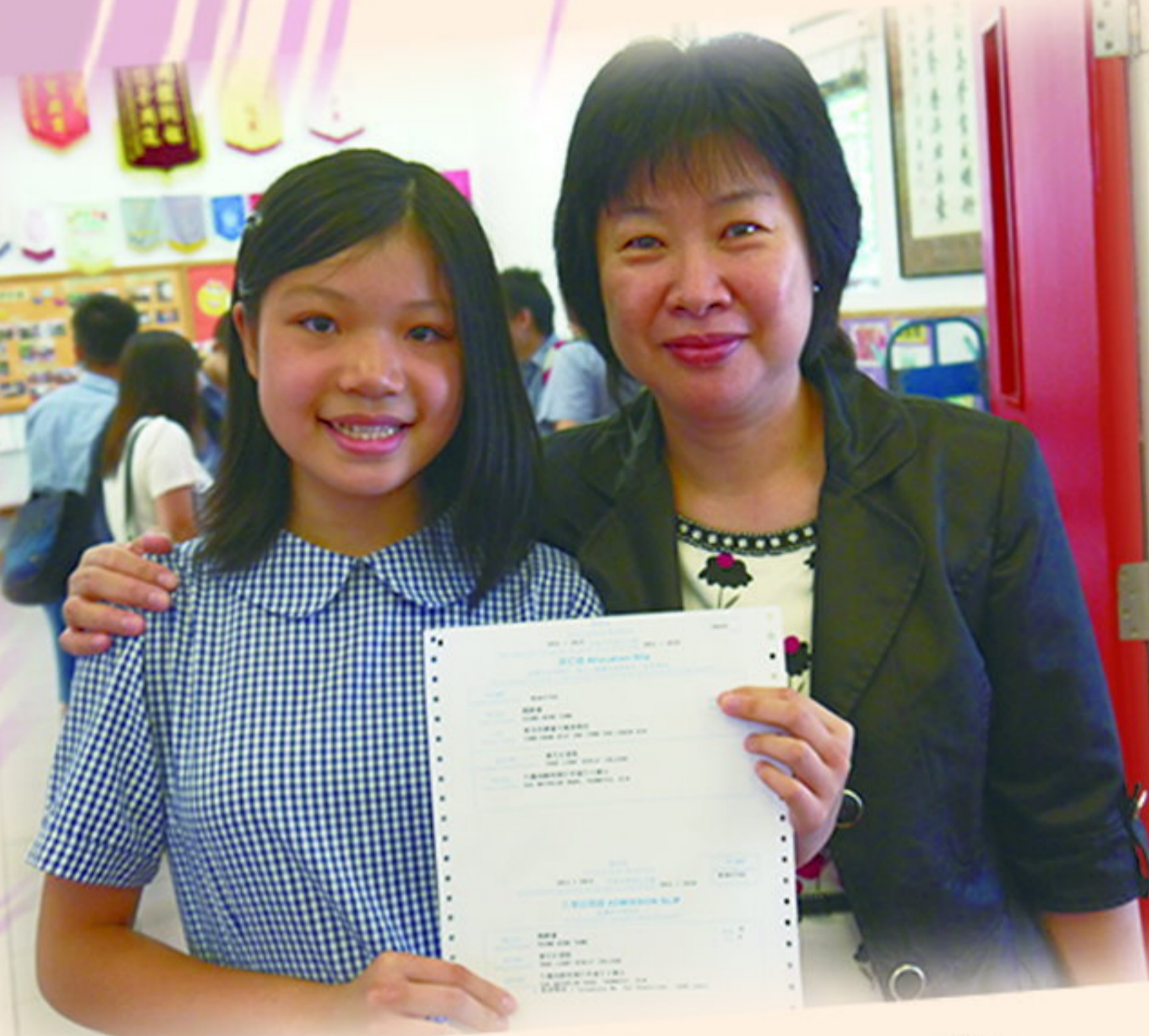
能派往第一志願中學，衷心感謝母校栽培。