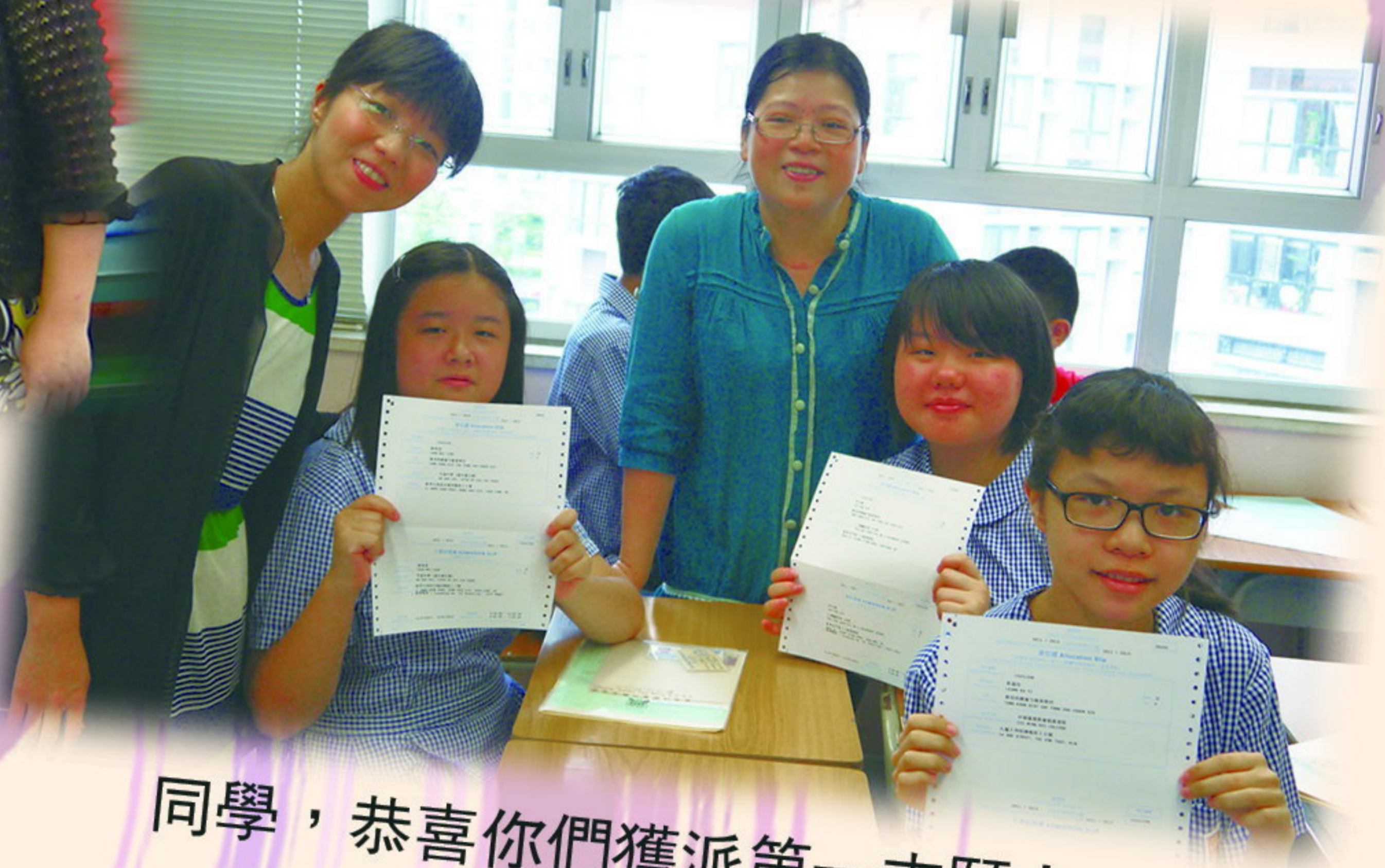
同學，恭喜你們獲派第一志願！