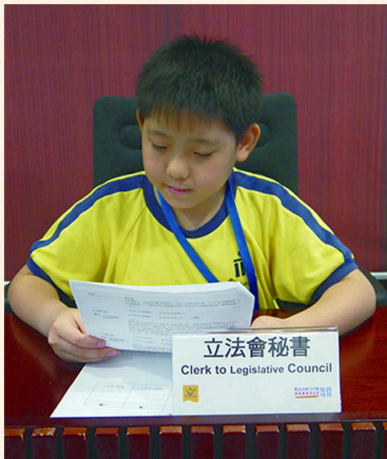
立法會秘書在審議草案。

今年暑假，本校為同學們開辦了不同的活動班，並首次邀請家長陪同學生參加校外參觀活動。在家人陪伴下，同學們都表現得更為投入，反應熱烈。不如讓我們一起回顧各活動的精彩片段吧！