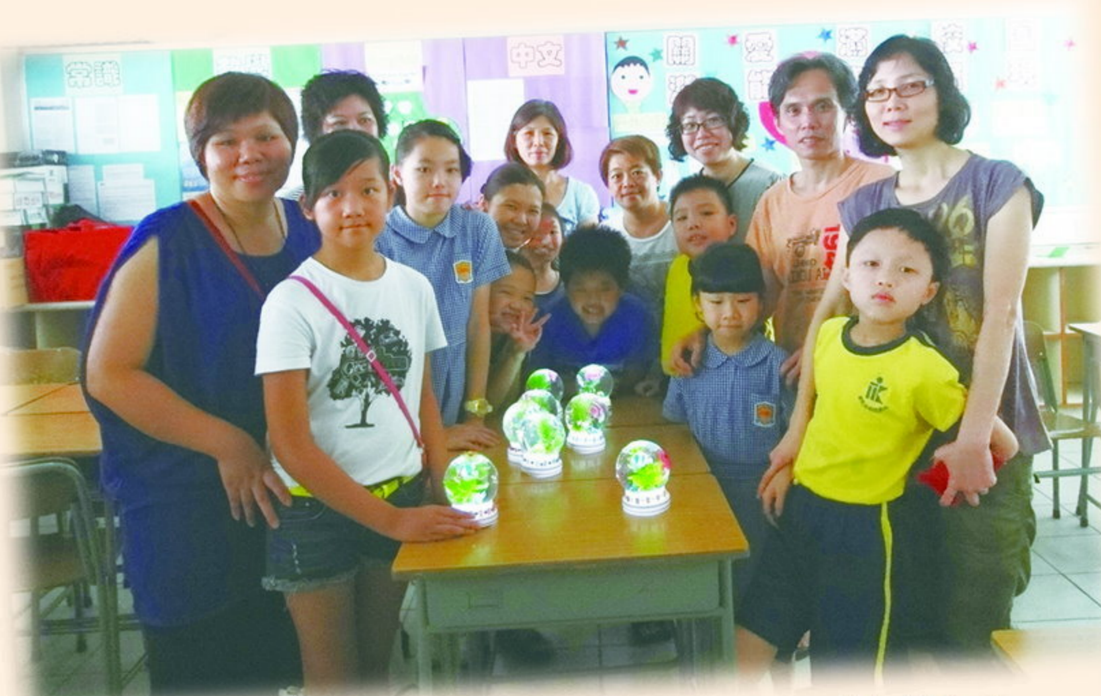
發放水晶球正能量——快樂！

本會與學校於 13-7-2013 合辦了兩個暑期親子興趣班，由「正能量義工隊」家長義工擔任導師，教授會員和其子女一同製作「創意橡皮擦」及「閃耀水晶球」。