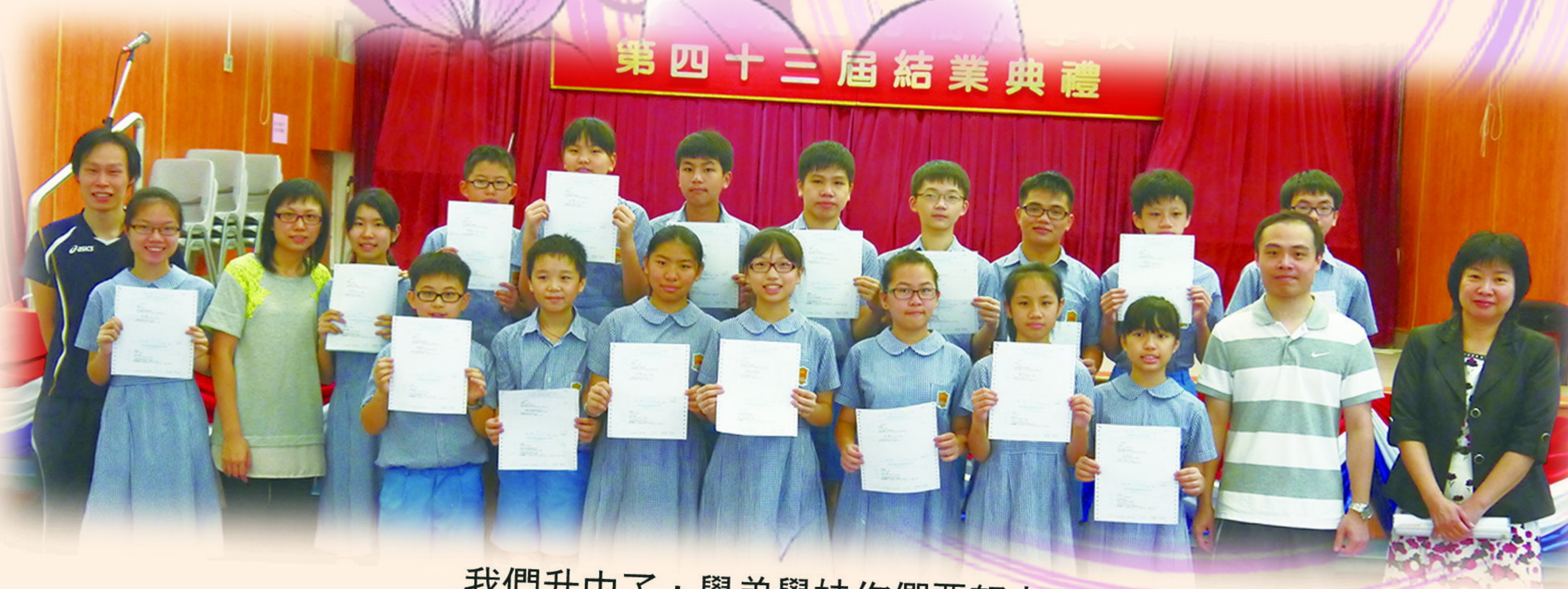
我們升中了，學弟學妹你們要努力啊！