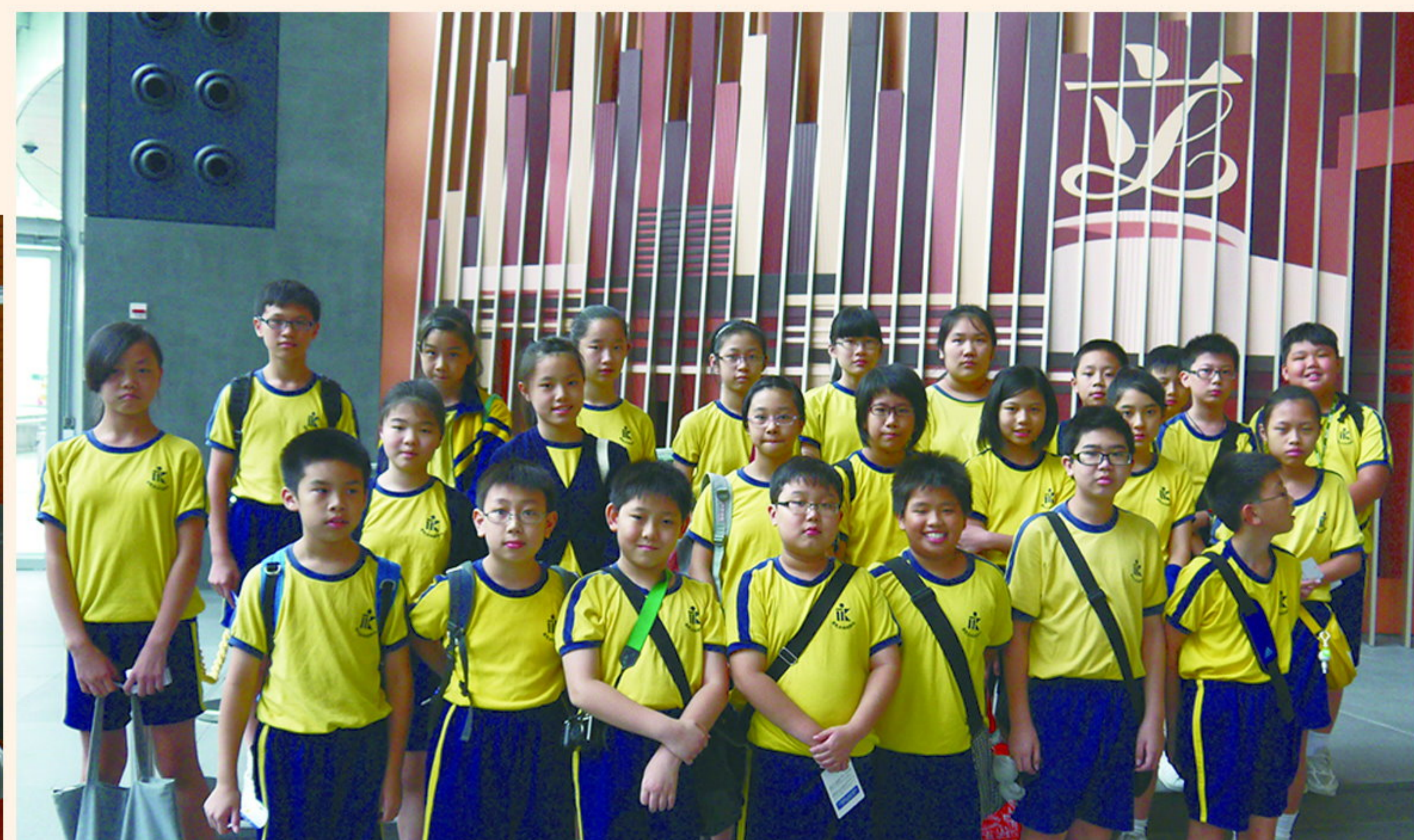
在立法會會徽前大合照。