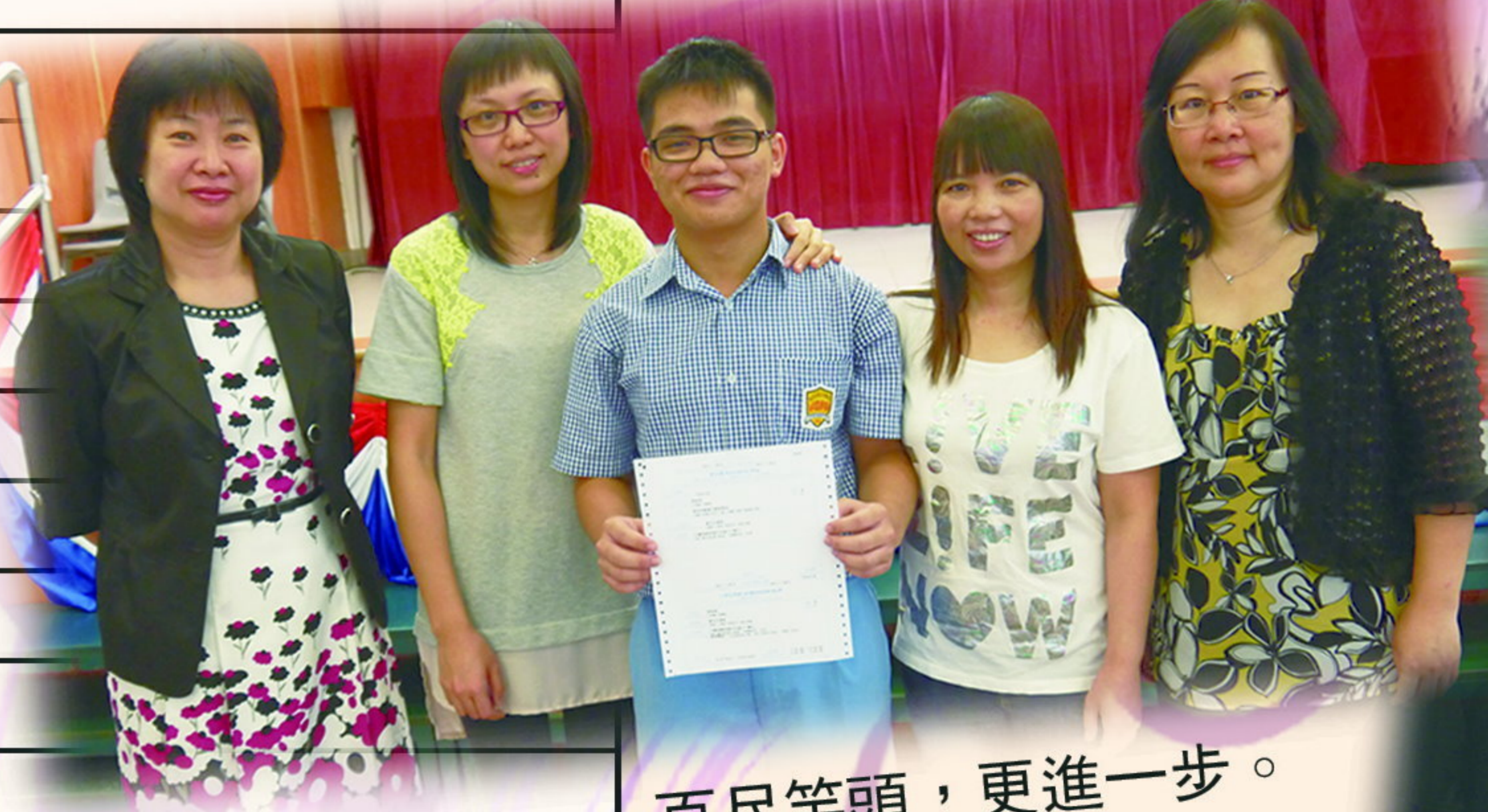
百尺竿頭，更進一步。