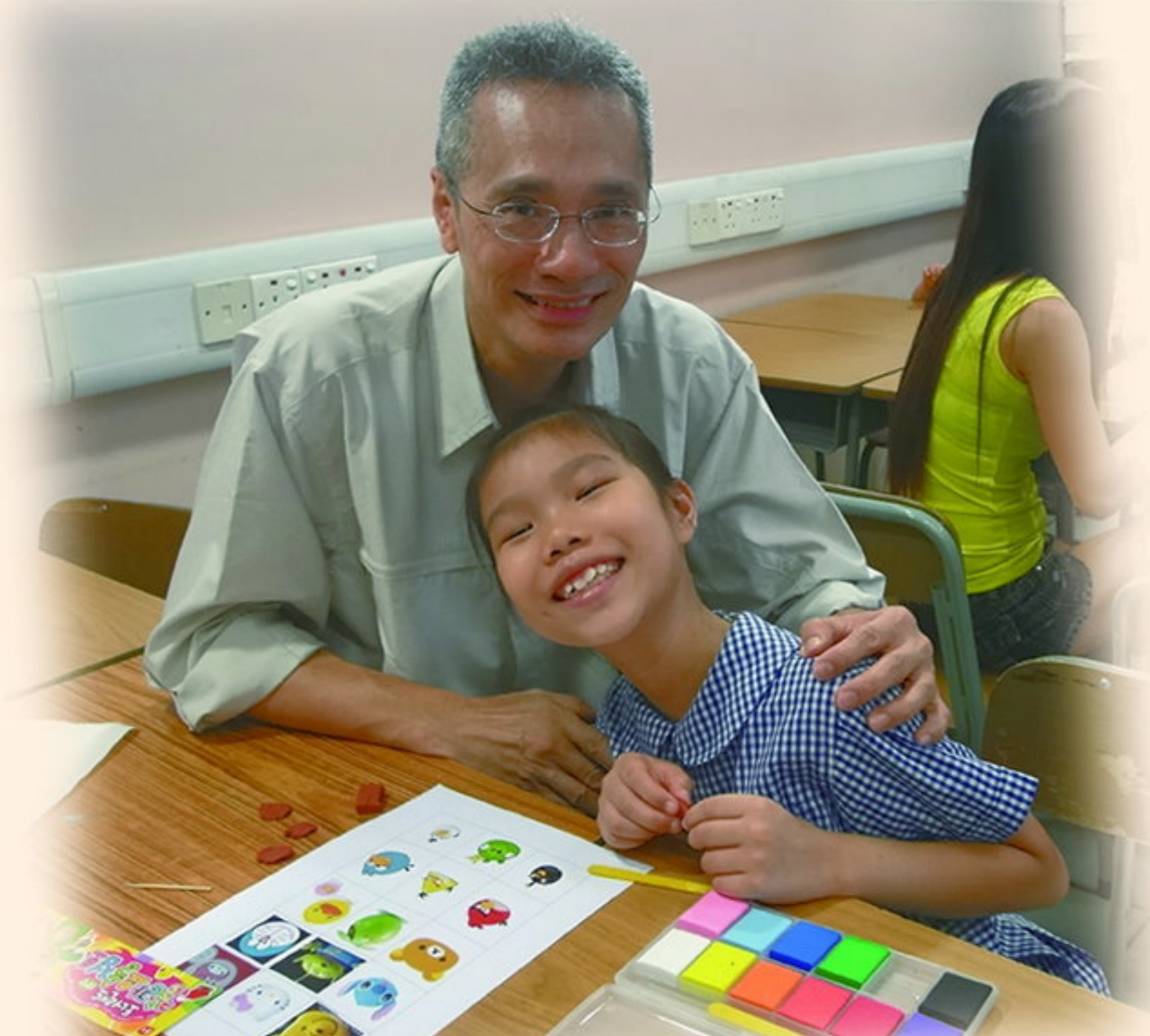
七彩繽紛橡皮擦，很期待！