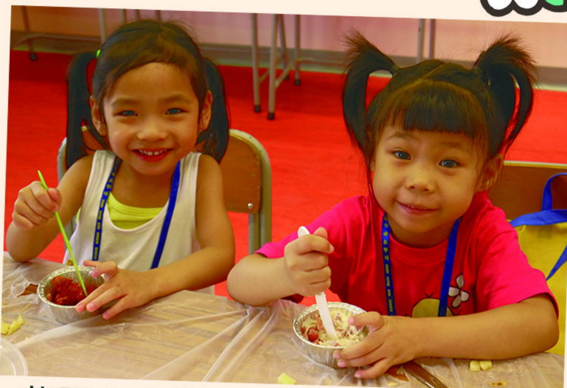
英語小廚師 - 吃！喝！玩！學！