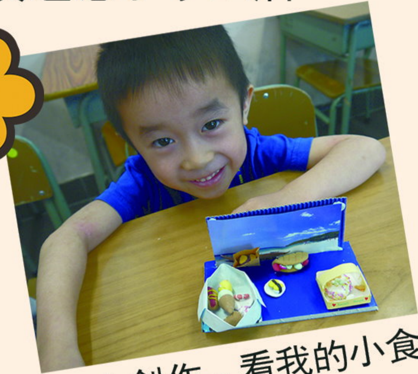
黏土創作 - 看我的小食店，食物款式真多啊！