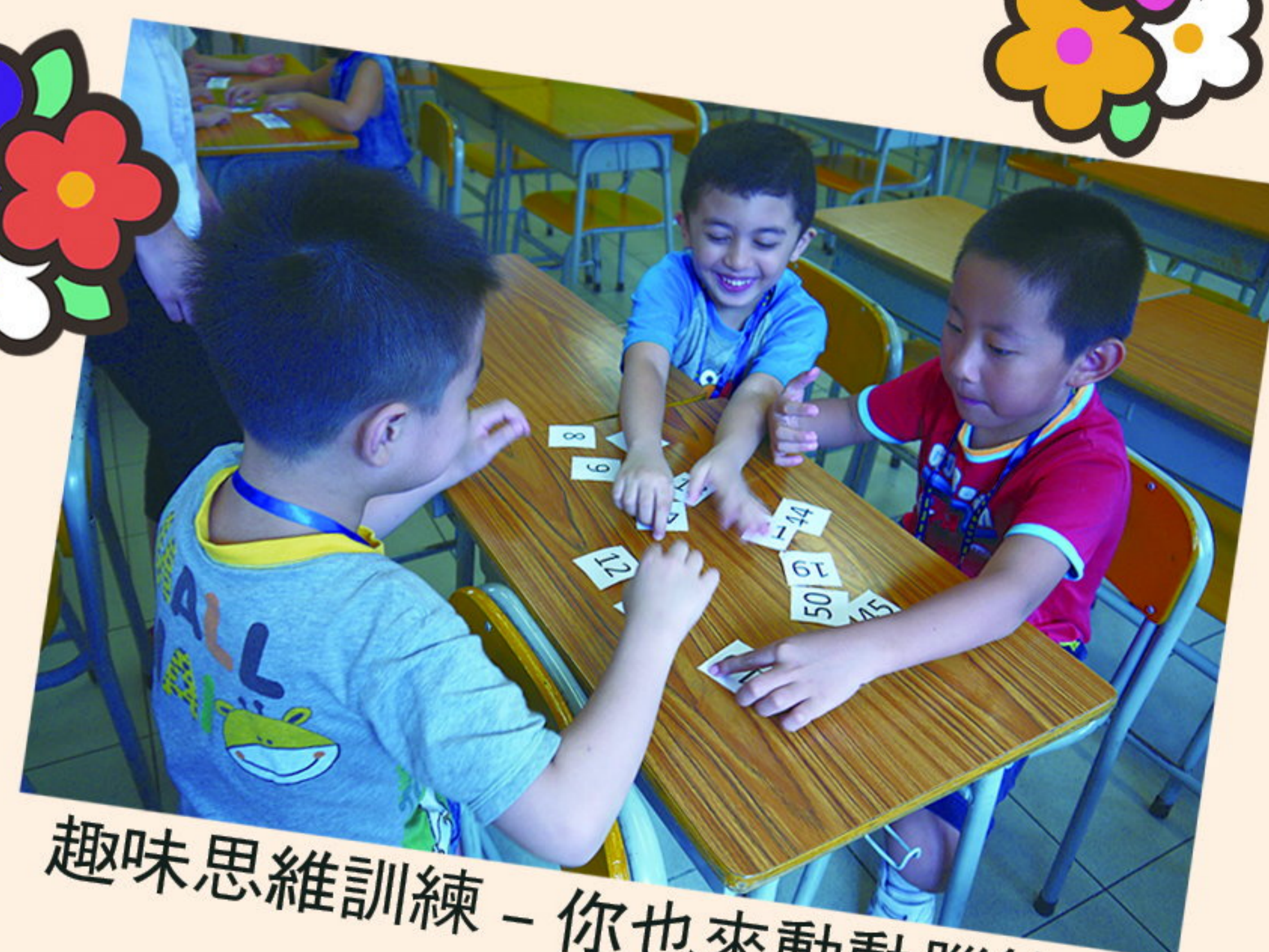
趣味思維訓練 - 你也來動動腦筋！