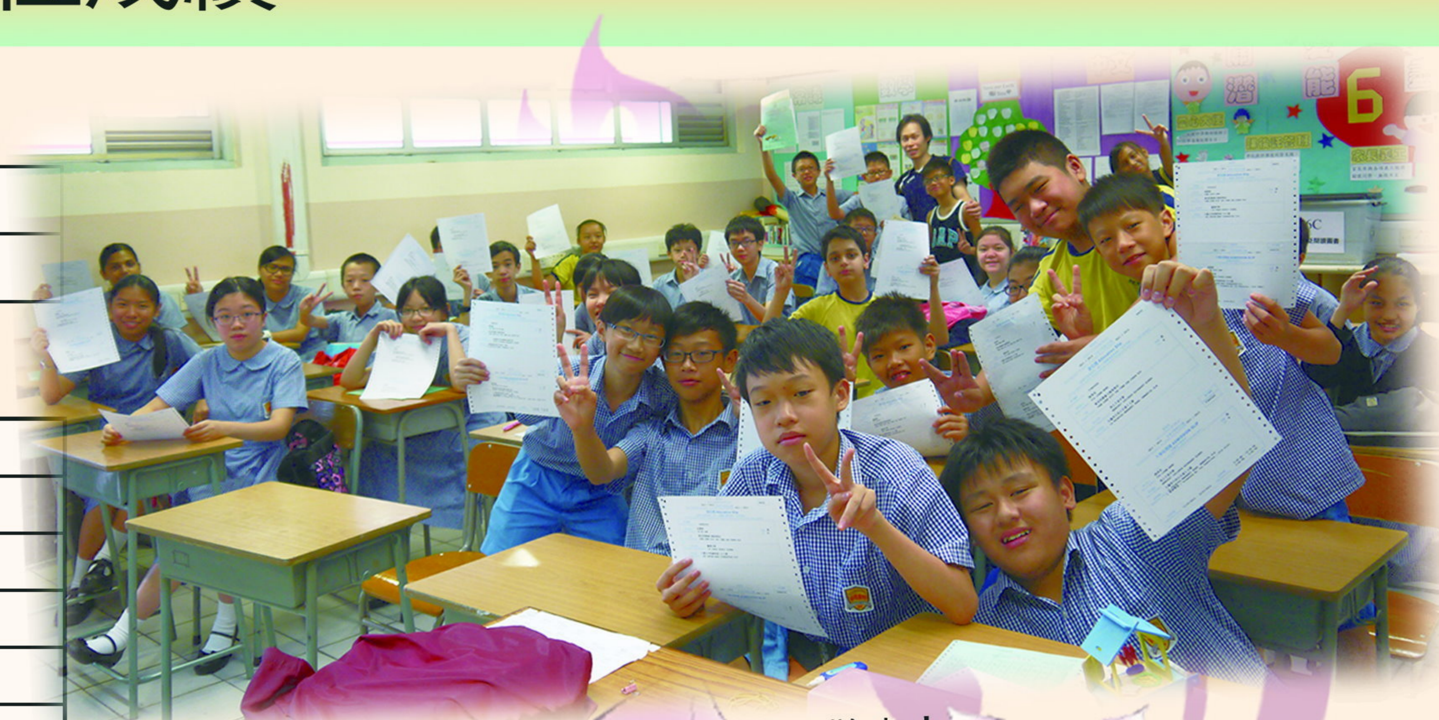
放榜一刻，皆大歡喜！