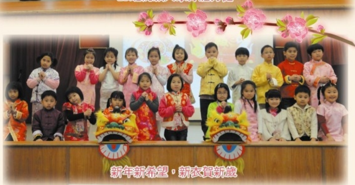
新年新希望，新衣賀新歲