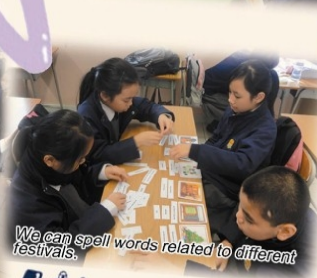
We can spell words related to different festivals.