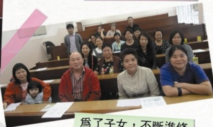
為了子女，不斷進修