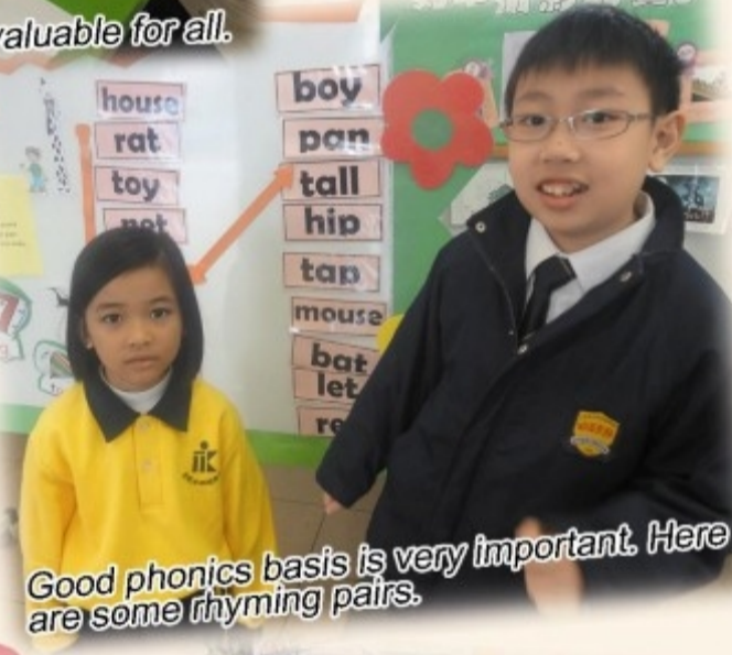
Good phonics basis is very important. Here are some rhyming pairs.