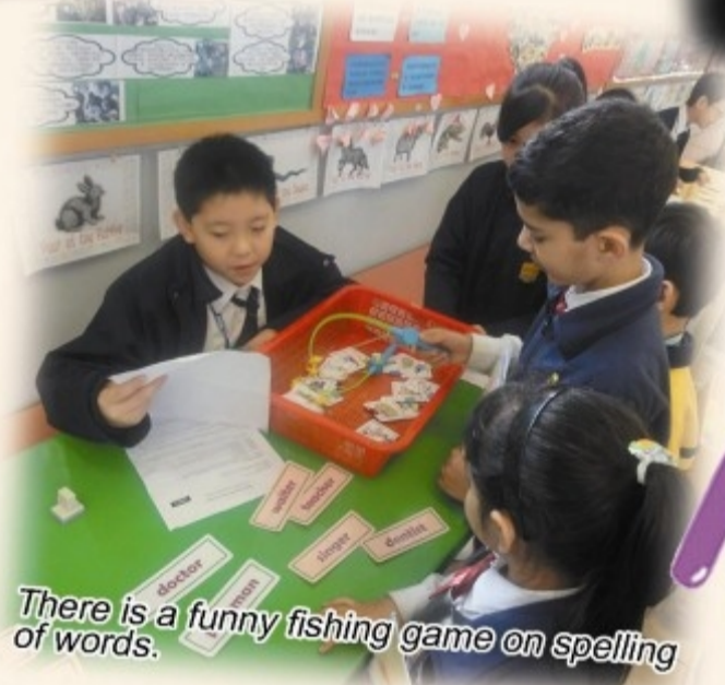
There is a funny fishing game on spelling of words.