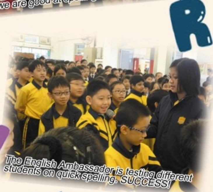
The English Ambassador is testing different students on quick spelling. SUCCESS!