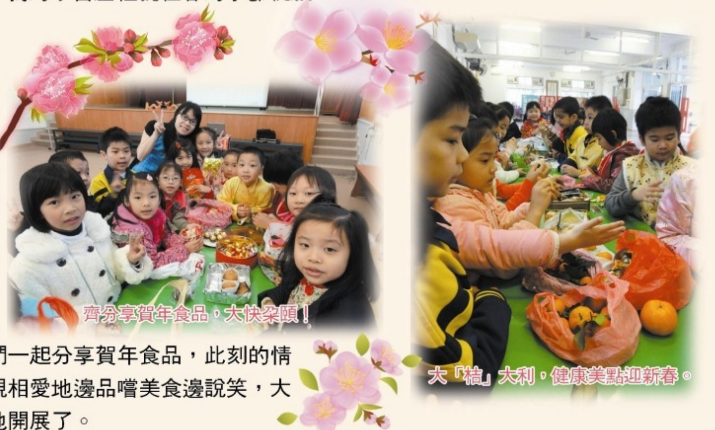
齊分享賀年食品，大快朵頤！

老師在十個學科圍繞同一主題——新春，教授不同的學科知識；然後又巧妙地把各科相關的新春知識串連在一起，知識得到遷移，各學科統整得更為緊扣，知識得以貫穿，學習就能鞏固。整個學習環節是連貫而有序，學生在音樂課掌握了鑼鼓節奏，到了體育課就會跟隨鼓聲學習舞獅的技巧和步法，結果，同學舞起獅來有板有眼，氣勢非凡！此外，學生在中文課學懂了賀卡的用語和格式，然後在視藝課運用新春元素，設計出獨一無二的賀卡封面，再由常識科老師教授新春的意義，協助學生把完成的賀卡郵寄到所屬的幼稚園，把他們的學習成果和節日的祝福送達師長的手中，以表敬意。這樣的學習方式，讓學生感受到知識是融會貫通的，一個歡樂並富意義的學習歷程就在春的季節綻放。