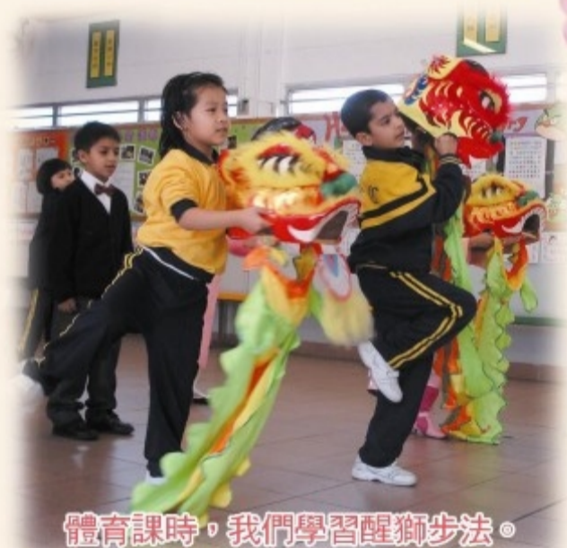
體育課時，我們學習醒獅步法。