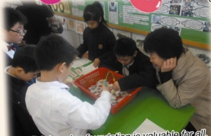
English learning foundation is valuable for all.