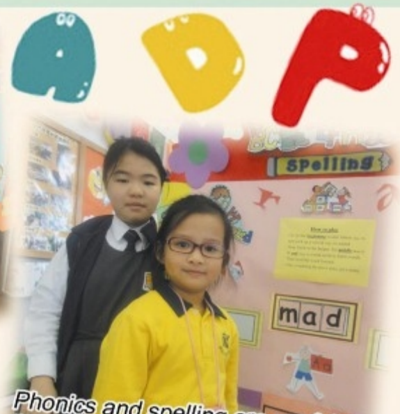
Phonics and spelling are useful and meaningful skills in English learning.