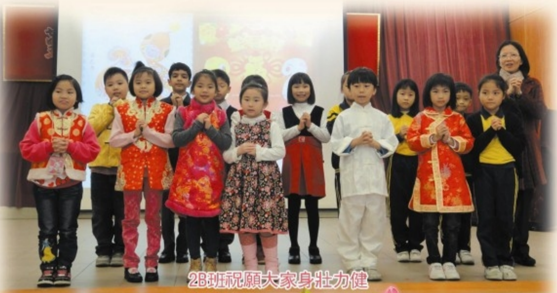
2B班祝願大家身壯力健

新春假期的第一個上課天，同學們穿起了中國傳統服飾，跟師長、同學拜年，把整個學習活動推向高潮。我們互相道賀，高唱賀年歌，在分組遊戲中認識更多新春習俗。二年級同學真棒！雖然他們的遊戲內容較深，但仍能應付自如呢！到了午膳，同學們一起分享賀年食品，此刻的情境，仿如兄弟姐妹無分彼此，相親相愛地邊品嚐美食邊說笑，大家樂在其中。一年的學習就這樣地開展了。