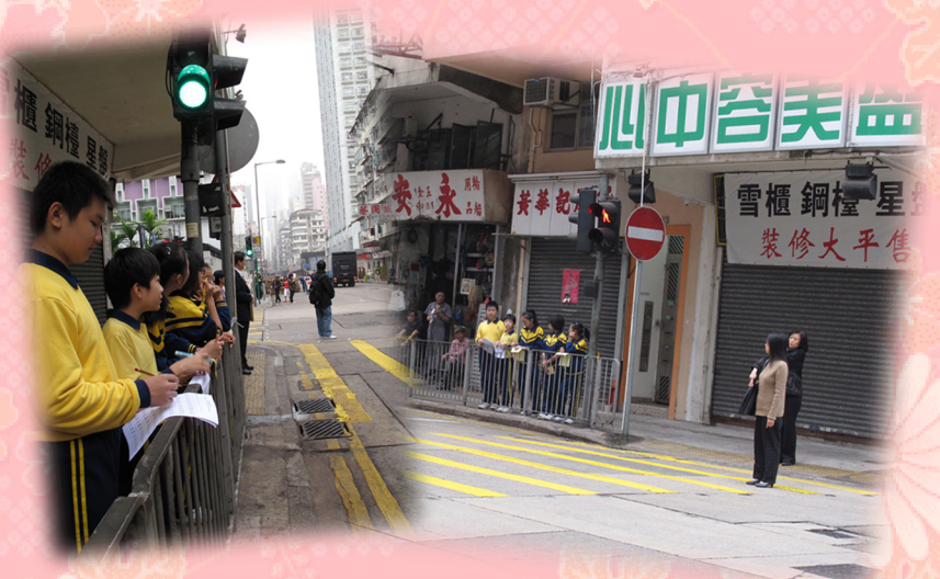
在新填地街近斑馬線位置進行實地觀察。