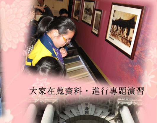
大家在蒐資料，進行專題演習