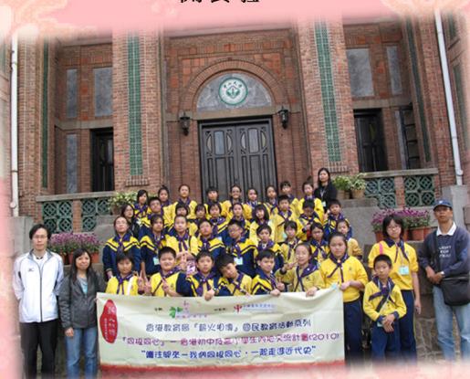
中山大學內的西式建築