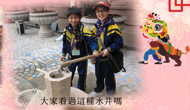
大家看過這種水井嗎