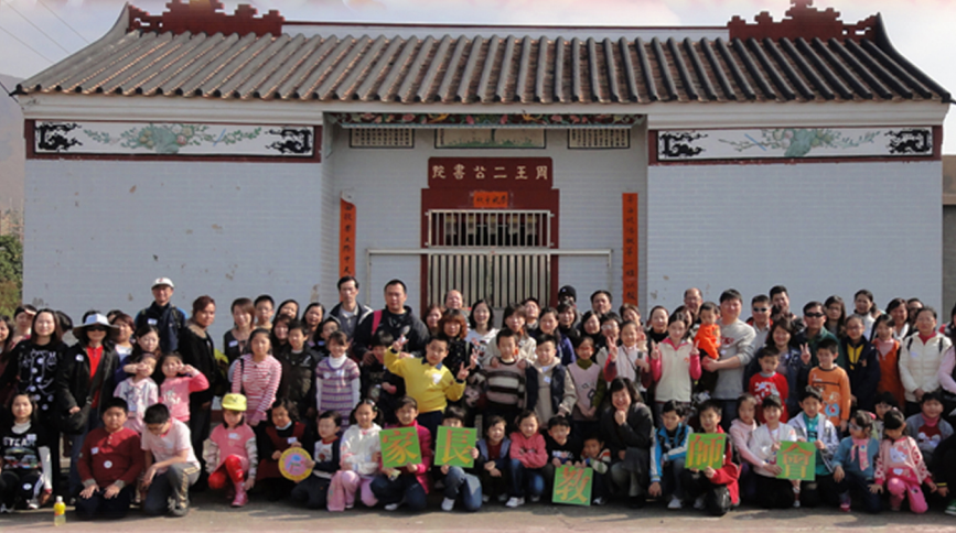
周王二公書院前大合照