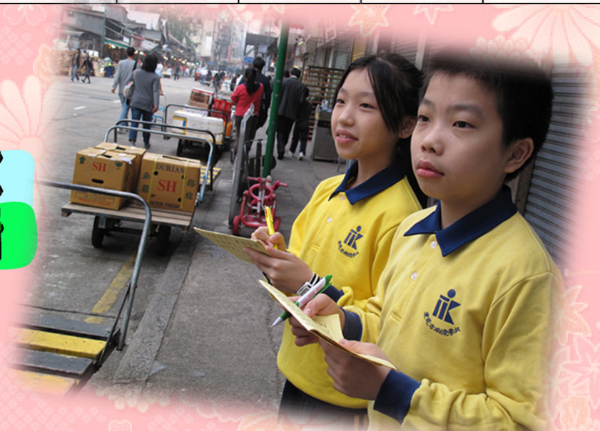
認真統計數據後再作分析