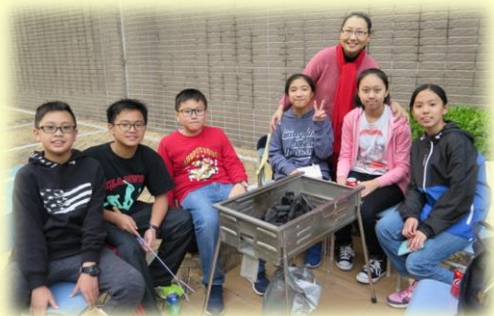
郭校長與校友合照。