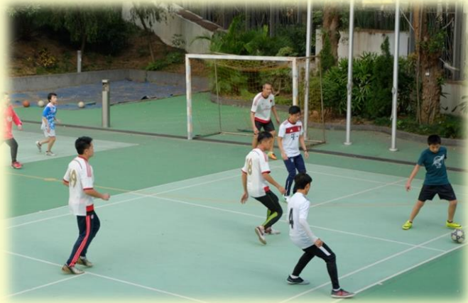
老師們與校友們均使出渾身解數。