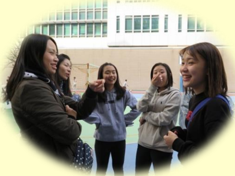
很久沒見了！ 葉主任與校友們開心說笑。