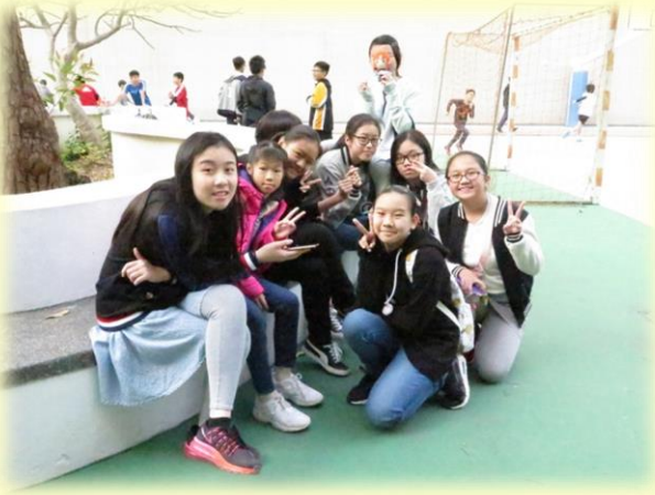
校友們的開心合照。