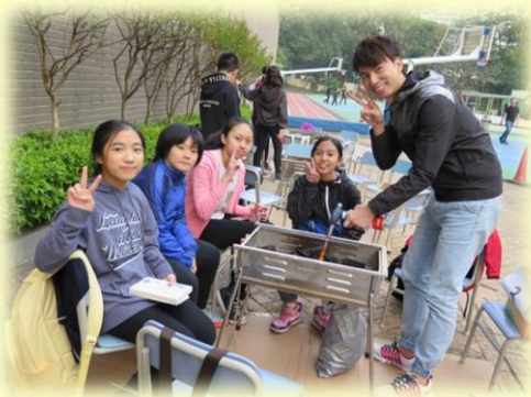
有梁主任的協助， 校友們都能順利燒烤。