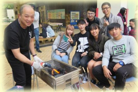
劉老師、黃主任與校友們開心合照。