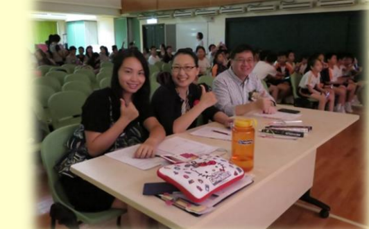
(上)葉主任、郭校長與主席擔任評判。