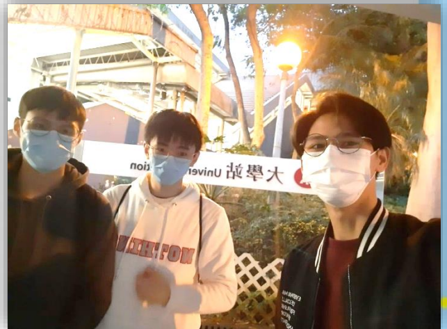
三位同學興奮地參加「中大生物醫學工程學系簡介會」