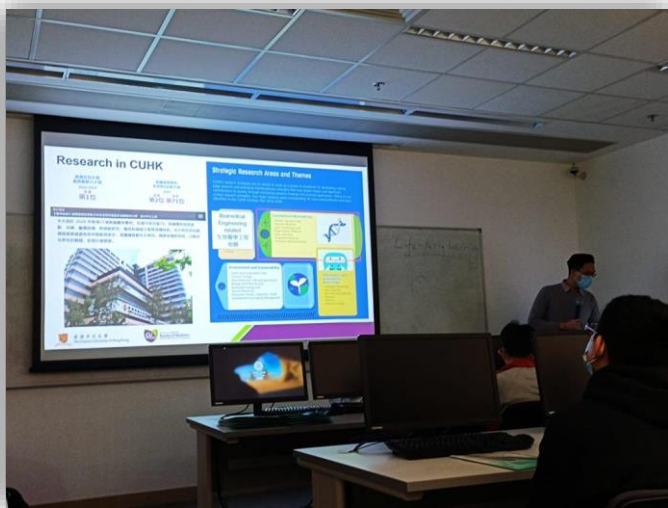
同學們親身進入大學的演講廳，體驗大學學習生活