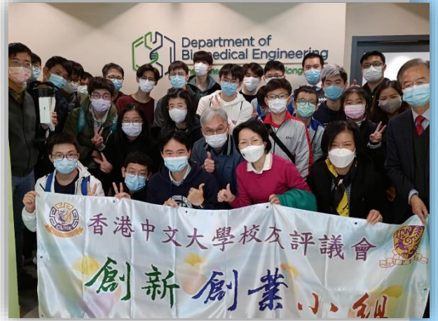
本校三位同學連同其他學校的精英參加「中大生物醫學工程學系簡介會」活動