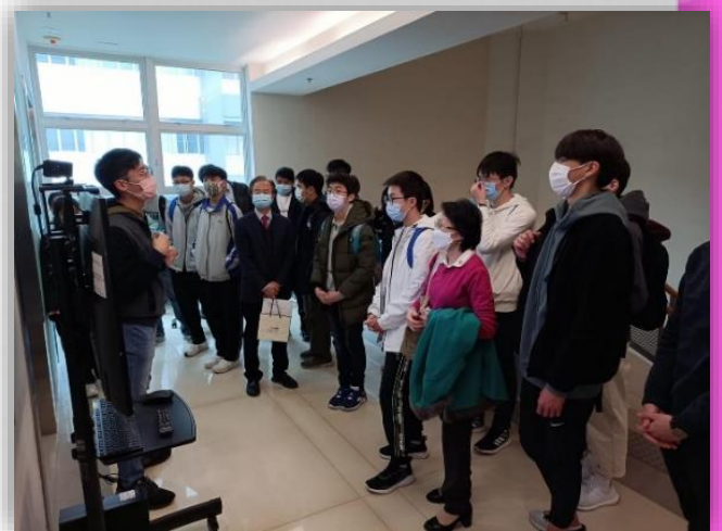
同學們留心聆聽導師的講解