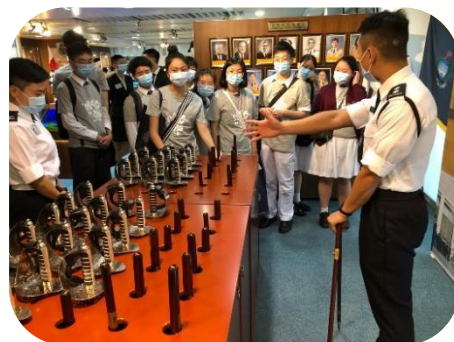
▲ 同學細心聆聽入境處職員介紹日常工作。