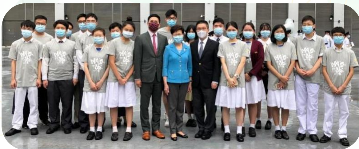
▲ 蔡嘉榮老師(右七)及同學與香港特區政府行政長官林鄭月娥女士(中)及入境事務處職員合影留念。