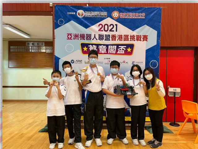
本校榮獲「機械人聯賽銀獎」及「新星獎」