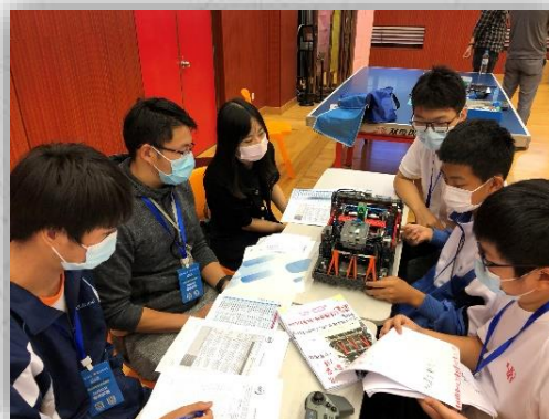
本校參賽同學向評審解釋機械人的設計

學生的作品是投射機械人，隊伍名稱是「求恩」。註：「新星獎」是與所有第一次參與同類賽事的隊伍中，累計最高分的參賽單位。