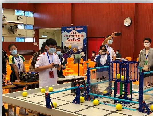
同學全程投入比賽