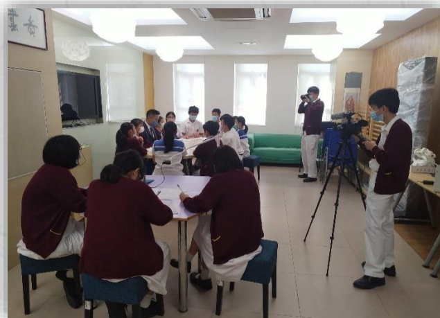
一場簡單而隆重的對談活動，同學們均認真準備