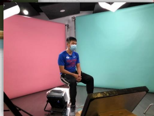
家鋒同學獲邀拍攝得獎片段，分享成功心得