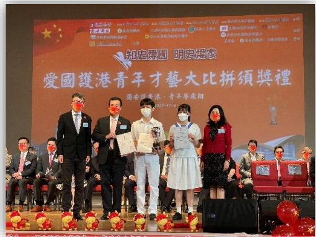
小組合唱項目獲頒優秀獎