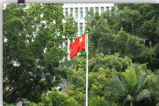
國旗飄揚，鼓舞人心