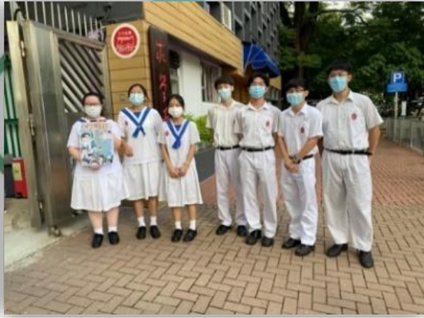
1 號內閣 Infinity 在校門宣傳

本學年共有兩個內閣參選學生會幹事會，分別為 1 號內閣 Infinity 和 2 號內閣 ECHO。經過為期兩星期的宣傳，投票日已於 10 月 4 日(星期一)舉行。共有 657 位求恩學生投票，投票率為 95.4%。當中 1 號內閣 Infinity 取得較多有效票。Infinity 依例合法當選為 2021/2022 學年學生會幹事會。