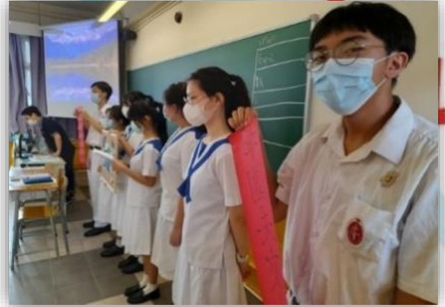
2 號內閣 ECHO 到課室宣傳