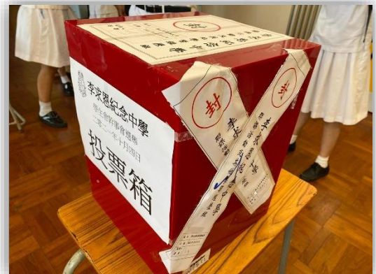
處理選票過程嚴謹認真