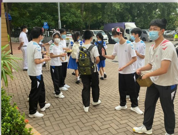
落力拉票，氣氛熾熱