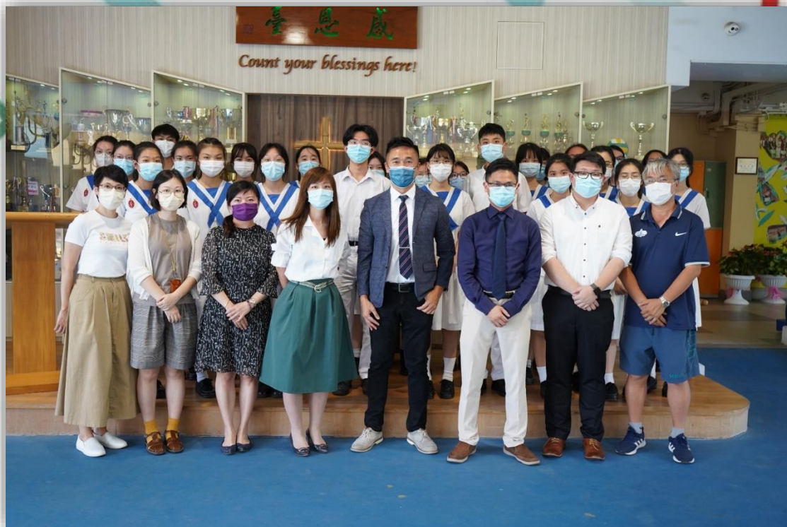
學生領袖與師長合照

本學年的學生領袖交接儀式於 10 月 11 日(星期一)於感恩台前舉行。在就職典禮中，新一屆的學生會幹事會內閣、各位學長、四大隊幹事團隊以及英語大使，均承諾會做好學生領袖的角色，成為學弟學妹的榜樣，發揮和傳承「求恩人」的特質。