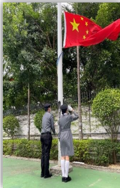
國旗在本校校舍冉冉升起