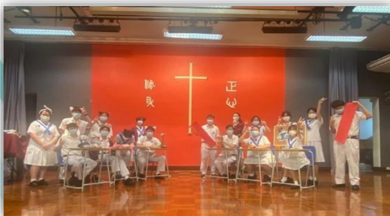
兩個候選內閣在政綱答問大會上互相發問，解說政綱