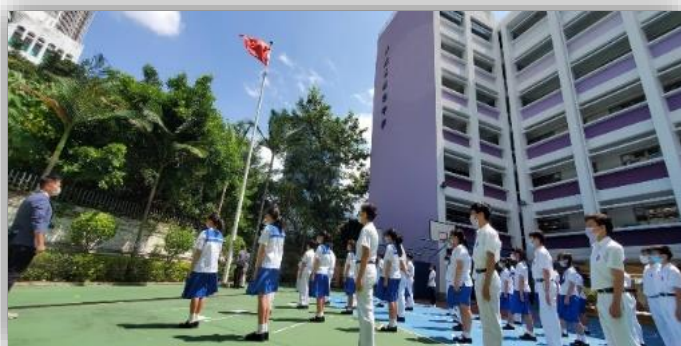
同學參與升旗禮，精神抖擻，嚴肅莊重