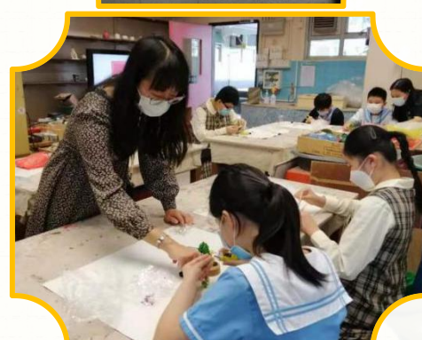
英語口語工作坊 (English Speaking Workshop)