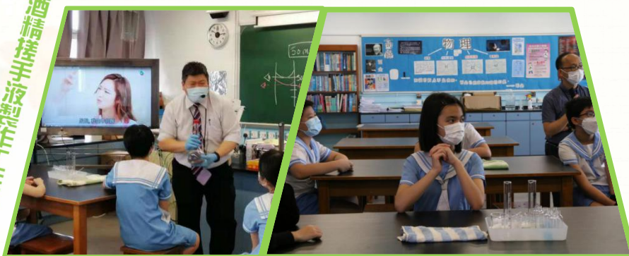
酒精搓手液製作工作坊