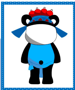
所獲獎項：優異獎 ▶ 創作者：6B 班 鄺文洪