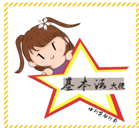
▲ 所獲獎項：優異獎 創作者：5A 班 呂康儀