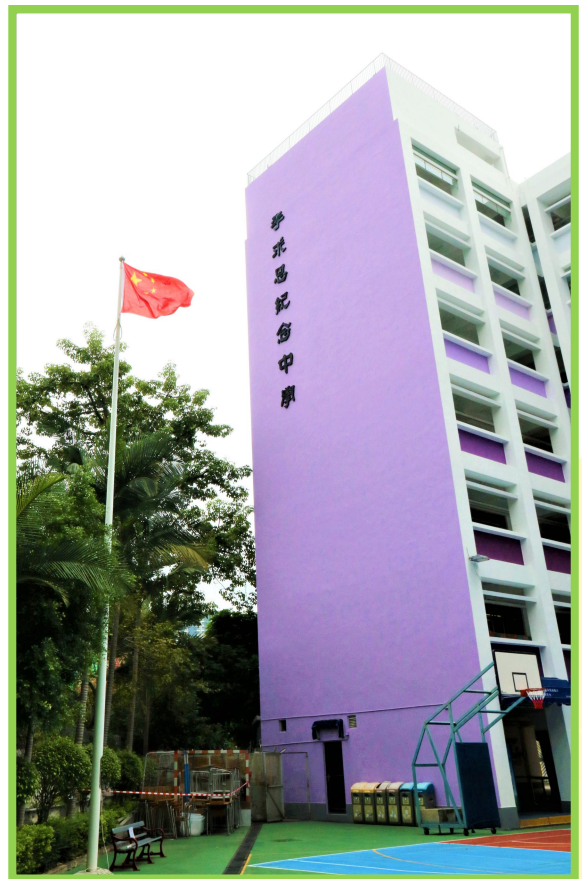
▲升旗禮結束後，國旗迎風飄揚。