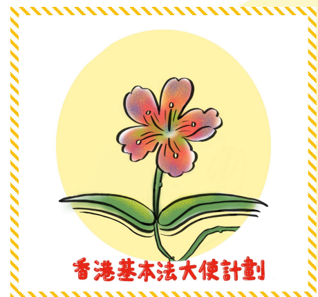
▲ 所獲獎項：優異獎 創作者：5A 班 黃小軒