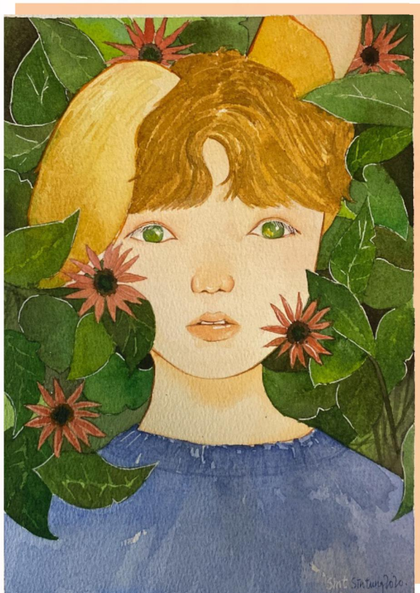
▲ 作品名稱：《Lovely Boy》水彩紙本 創作者：6B班 黃倩桐