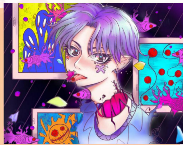
▲ 作品名稱：《怪》數碼繪圖 創作者：5A班 羅佩兒