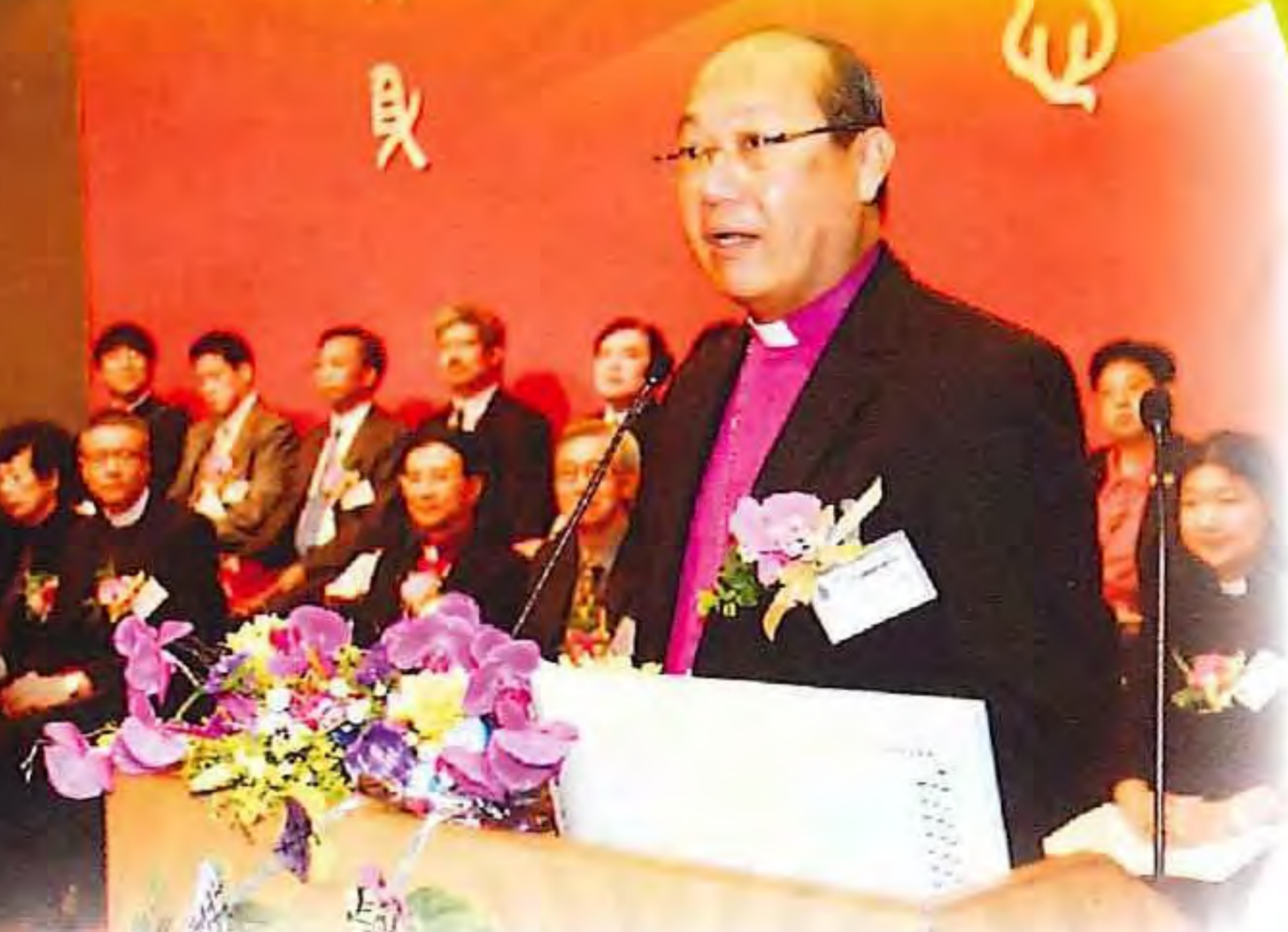
▲ 鄺保羅大主教致訓辭