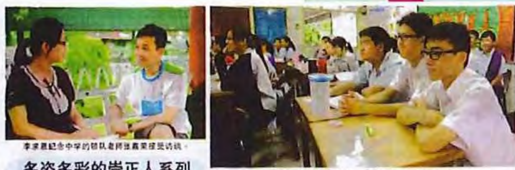
充滿國際色彩的崇正之夜 有朋自遠方來 不亦樂乎