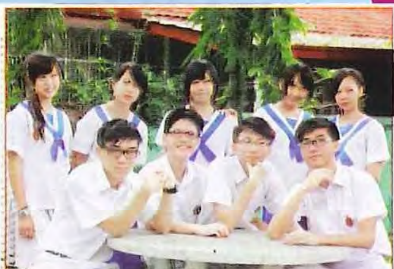
香港同學在崇正的「葯草園」留下美麗的回忆。

沙巴崇正中學與香港李求恩紀念中學教師交換教學計劃簡訊。沙巴崇正中學與香港李求恩紀念中學教師交換教學計劃簡訊。沙巴崇正中學與香港李求恩紀念中學教師交換教學計劃簡訊。