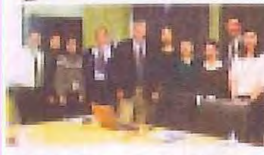
沙巴崇正中學與香港李求恩紀念中學教師交換教學計劃簡訊