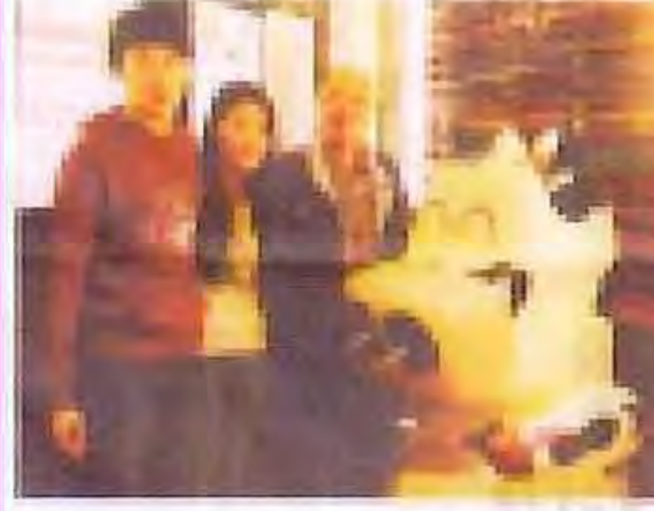
沙巴崇正中學與香港李求恩紀念中學教師交換教學計劃簡訊

本報——沙巴崇正中學與香港李求恩紀念中學教師交換教學計劃簡訊。沙巴崇正中學與香港李求恩紀念中學教師交換教學計劃簡訊。沙巴崇正中學與香港李求恩紀念中學教師交換教學計劃簡訊。