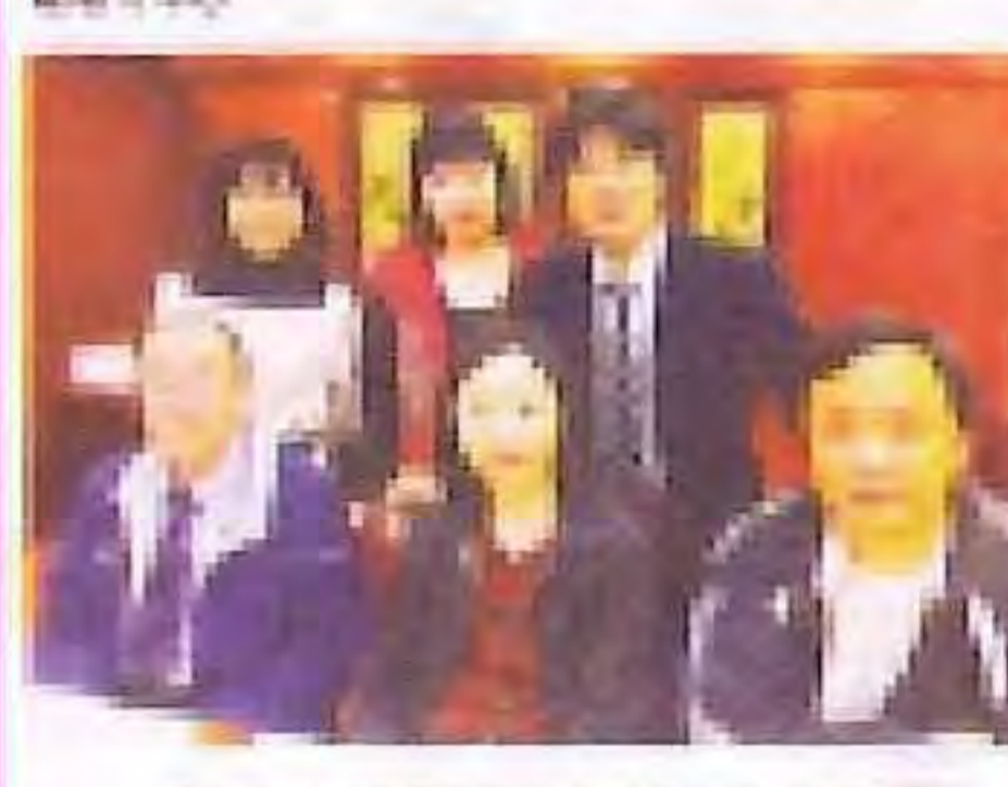
沙巴崇正中學與香港李求恩紀念中學教師交換教學計劃簡訊