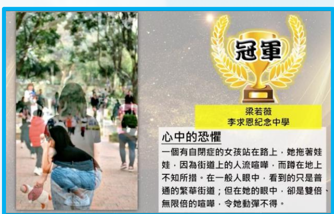
▲「共融@動靜一刻」創作比賽攝影作品及賽果。