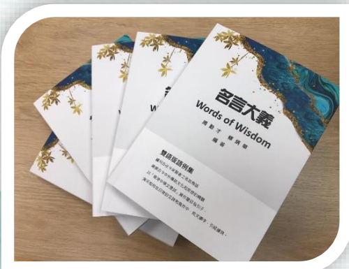
▲ 《名言大義(Words of Wisdom)》出版。

2月14日，由本校第七屆知名校友周勤才老師和賴炳華校長編著的《名言大義 (Words of Wisdom)》順利出版，周勤才老師素有「中文天王」之稱，而賴炳華校長則在翻譯及英語教學上造詣精深。該書臚列古今智者名言雋語，以「香港中學文憑試」寫作題目為例，演示如何在日常的交談與寫作中引經據典。同時中港文化交流促進會發起《名言大義 (Words of Wisdom)》贈書活動，向各中學贈送圖書，現時已有 20 多間中學報名索書。冀望該書能幫助考生們在香港中學文憑試考試中奪取佳績。