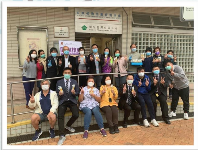
▲ 一眾嘉賓、家長義工及本校老師與東匯邨物業管理處代表合照。

3月11日，本校參加由香港中文大學校友會聯會、香港中文大學校友會聯會教育基金會、香港中文大學校友校長會、香港中文大學學生事務處及校友事務處主辦的【中大校友·同心抗疫—配製及派發酒精搓手液】活動。