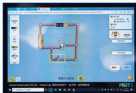
▲ 同學應用網上的模擬程式加深理解科學概念。

整體而言，本校落實「停課不停學」策略，通過網上課堂開展學與教，在確保師生健康及安全的前提下，幫助學生更好地學習，適應在線學習的模式，提供高質量的教學。