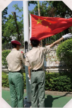
▲ 升旗手撒旗動作優美，勻稱有力。

本校在 10 月 2 日的初中週會及 10 月 4 日的高中週會中舉行國慶升旗禮。學生們在操場排列整齊，並由升旗隊負責升旗儀式，氣氛莊嚴。