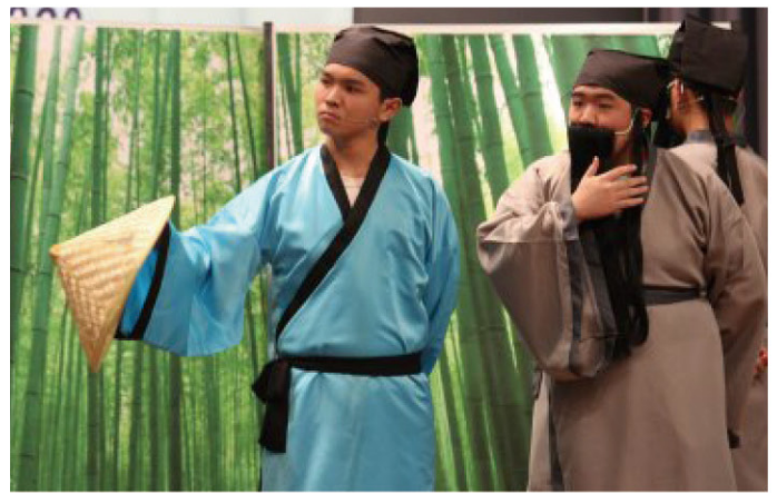
▲ 本校中四及中五級同學，以蘇軾《定風波》為藍本，改編朗讀劇場《也無風雨也無晴》。