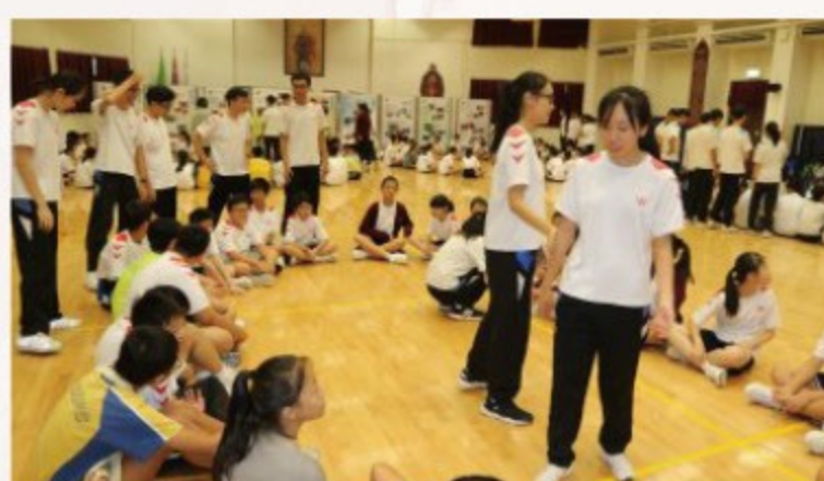
▲ 在禮堂進行集體遊戲，體現團隊合作精神。