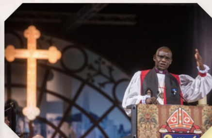
▲ 聖公宗秘書長艾度華·費倫大主教講道。

香港聖公會教省在 10 月 6 日（星期六）下午，假亞洲國際博覽館舉行成立「20 週年感恩聖餐崇拜暨晚宴」，當中以《同建教會歌》作主題聖詩，並由普世聖公宗秘書長艾度華·費倫大主教講道，場面盛大。