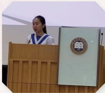
▲ 我校同學代表亦分享參加這個計劃的得著。

香港浸會大學教育學系舉辦之「長幼同行成長路計劃」，在 10 月 5 日舉行，這計劃的目的是提供一個平台，讓專業人士、大學生、中學生及長者進行交流和學習，藉此建立跨世代跨學科的「學習社群」。