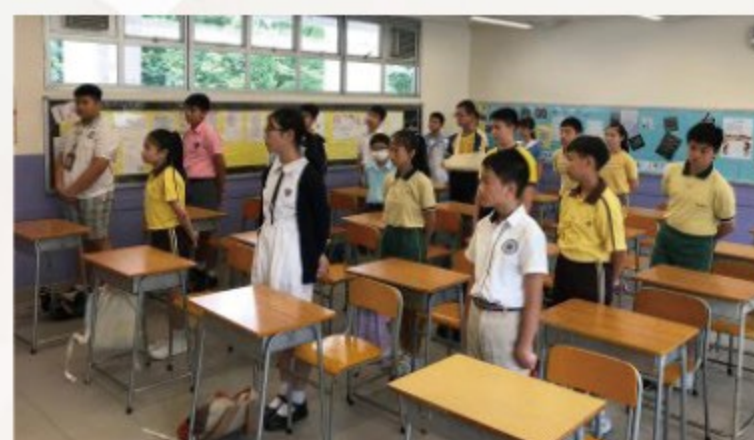
▲ 在班房內學習課堂規則，認識學校的校規。

「我覺得課程對中一學生很有用，明白要尊重老師；雖然中學的校規比小學嚴格，但我很快便適應和享受中學生活，最喜歡上中史堂。」