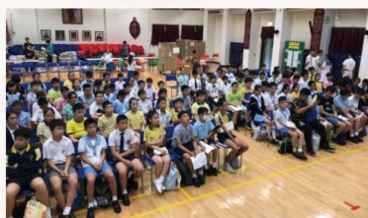
▲ 在禮堂細心聆聽講解及觀賞精彩表演。