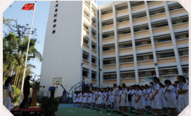
▲ 為了慶祝國慶，本校在 10 月的兩次週會上，舉行升旗禮。