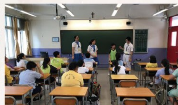
▲ 輪流作自我介紹，增加彼此認識。