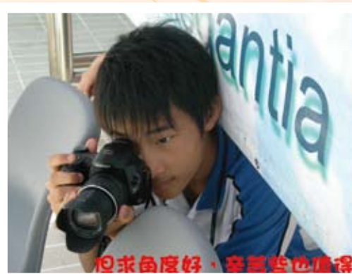
但求角度好，寧願苦也值得