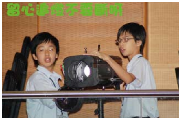
留心連燈不要斷呀