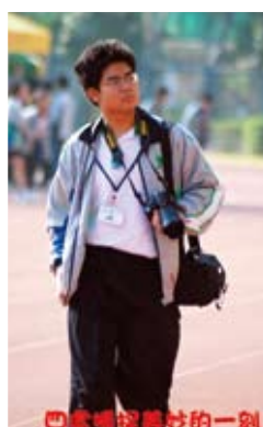
巴拿馬運籌帷幄的一刻