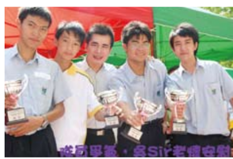
北區青少年暑期活動攝影比賽 獲冠亞季殿軍