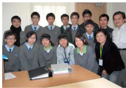
舞台代表與編委合照

有專家指出：「一隊專業而有水準的舞台工作隊伍可以把三流的舞台表演提升至二流甚至一流；相反若由一隊三流的舞台工作隊伍負責操作演出，一流的表演也會降至二流甚至三流。」可見對於演出活動，舞台工作隊是何等重要。