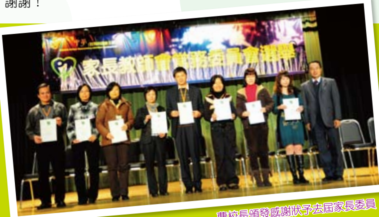
曹校長頒發感謝狀予去屆家長委員

今天，我真誠的與你分享，並誠邀你的參與，齊來為孕育我們下一代的校園獻出一點時間，貫徹實行家校合作的精神。謝謝！