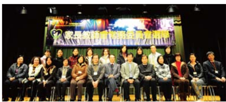
校長、副校長與參選家長、去屆委員合照