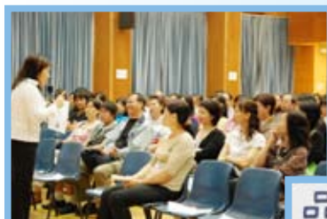
學習技能提昇講座