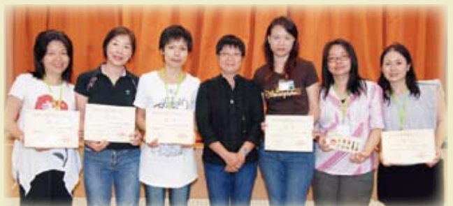
梅老師（中）與部分得獎學員合影