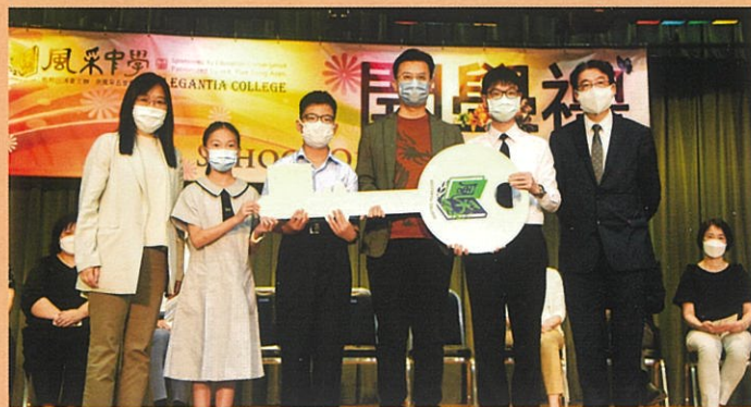
中一新生代表從學長手上接過學習鑰匙