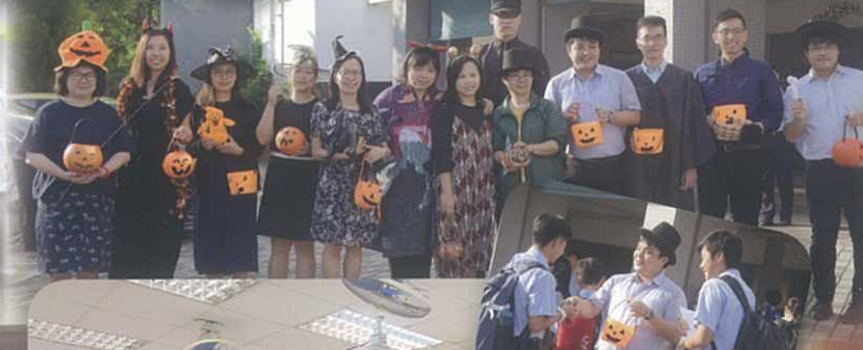
英文科萬聖節活動