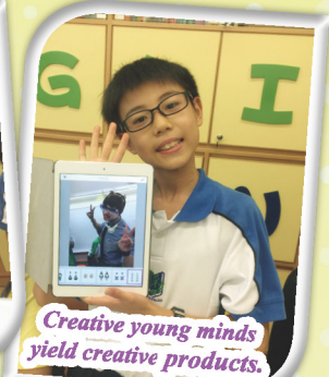
Creative young minds yield creative products.

Learning English is always fun in Elegantia. We are striving for enhancing students' sense of belonging to the active English-learning culture at school and arousing their interests in the English language through various interactive activities both inside and outside the classroom.