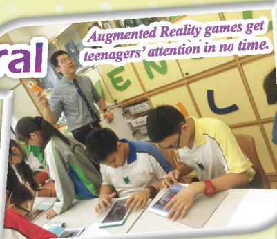
Augmented Reality games get teenagers' attention in no time.