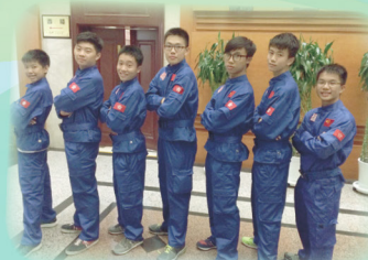
Young Astronauts in uniforms at Jiuquan Satellite Launch Center