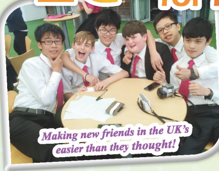
Making new friends in the UK's easier than they thought!