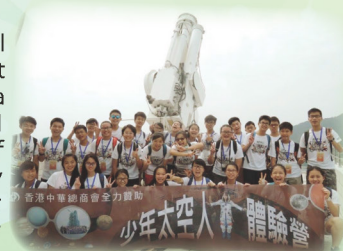
Visiting National Astronomical Observatories

Finally, I would like to thank the Astronauts Centre of China, organizers of this camp, my school and my parents. I hope this program can continue as it is invaluable for all students interested in science and technology.