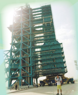
I look tiny in front of the magnificent launch tower