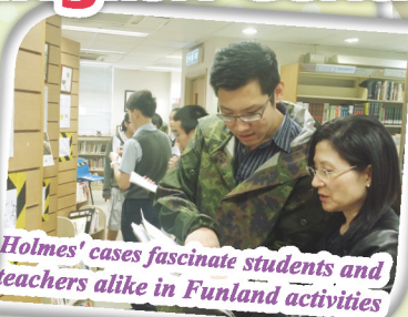
Holmes' cases fascinate students and teachers alike in Funland activities