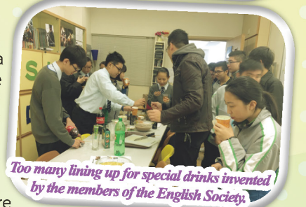
Too many lining up for special drinks invented by the members of the English Society.

With our concerted efforts, we create an English-rich environment for our students. English is truly alive here at Elegantia, everywhere, every day, and everyone.