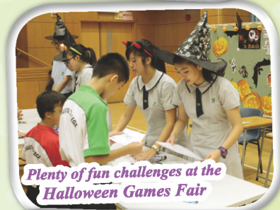
Plenty of fun challenges at the Halloween Games Fair