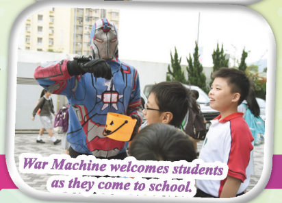
War Machine welcomes students as they come to school.