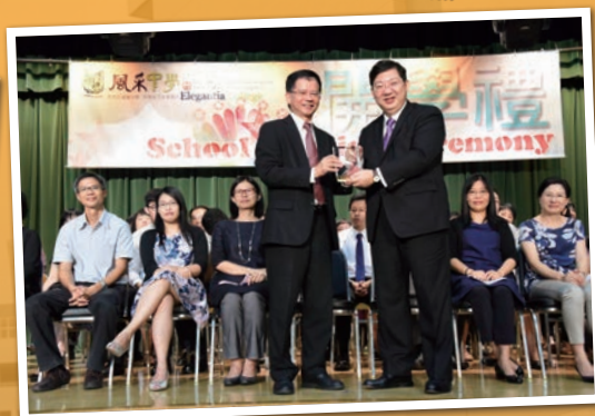
恆生管理學院院長何順文教授擔任本校開學禮嘉賓