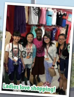
Ladies love shopping!

Four students from our school joined the Canada Leadership Camp at Kamloops, British Columbia from 18 July to 1 August organized by Canada-China Culture and Education Association Ltd and Thompson Rivers University. During the trip, they had an excellent opportunity to engage in case studies and group discussions, do projects and presentations in an English-speaking setting, experience different cultures and broaden their horizons. Let's hear the voices from their hearts: