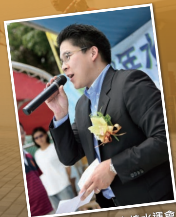
霍啟剛先生親臨本校水運會，並致辭鼓勵同學