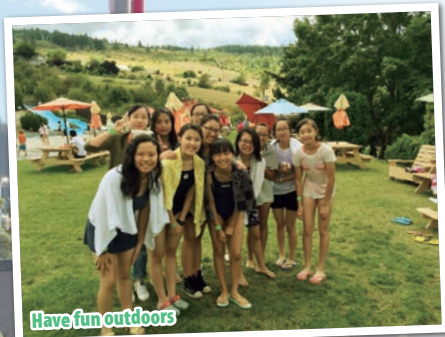
Have fun outdoors