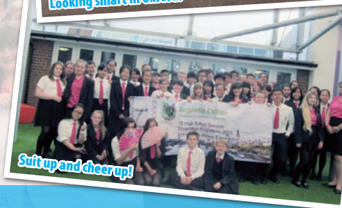
Suit up and cheer up!