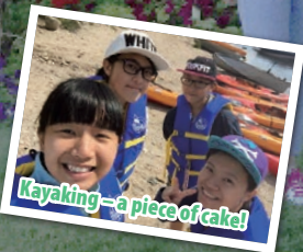
Kayaking - a piece of cake!