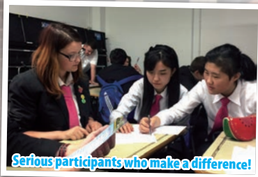
Serious participants who make a difference!

In addition to enlightening academics, what was definitely not to be missed was the rich local cultural exploration in Oxford where students witnessed world-class collections of historic architectures, fine arts and artifacts spanning literally centuries.