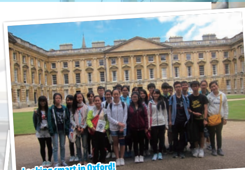
Looking smart in Oxford!