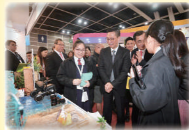
教育局局長楊潤雄 JP 親臨攤位指導