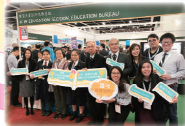
教育局局長楊潤雄 JP 親臨攤位祝賀