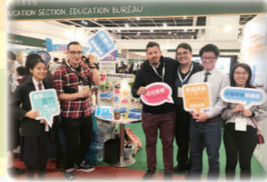
教育界同業觀摩如何運用 Cocorobo 物聯網技術