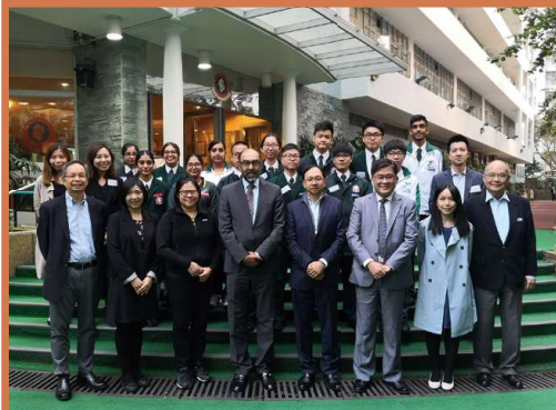
翁副校監歡迎巴基斯坦總領事訪校

此外，在翁副校監的協助下，中國網絡遊戲開發商和營運商的領導者，中國在線教育、企業訊化行業領先之一的網龍網絡有限公司樂捐電子白板予本校，並透過該公司的教育部，協助本校發展互動的教材，提升教師與學生之間的互動，令學生更能享受課堂樂趣，提升學與教效能。