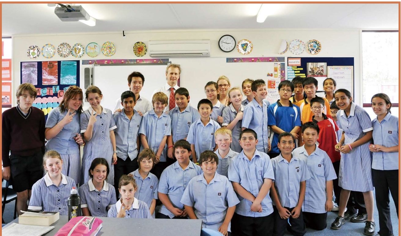
本校師生與澳洲Mowbray College師生合照

為擴闊老師及學生的眼界，翁副校監亦於每年慷慨全數贊助師生參加由中國探險學會舉辦的交流活動，老師及學生有機會跟隨中國探險學會黃效文會長及一眾專家到雲南香格里拉、海南島、台灣阿里山及緬甸等地區進行實地體驗交流活動。