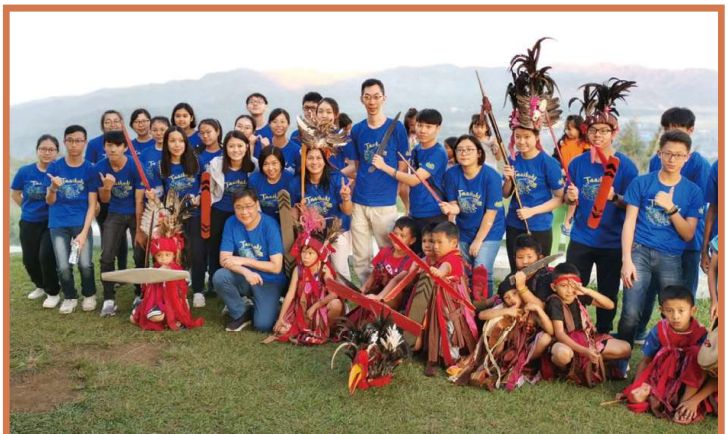
印尼野生動物救援中心考察團師生與當地小朋友合照