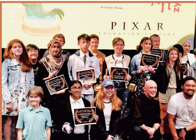
本校學生出席美國迪士尼國際青少年動畫大賽2018